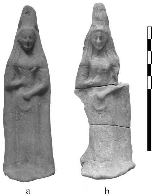
Fig. 4 - Figure stanti con corona nel bassoventre. a) San Biagio, b) santuario urbano