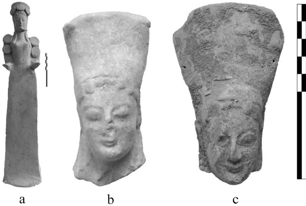
Fig. 5 - Figure composite stanti. a) San Biagio, b) santuario urbano, c) Crucinia-Favale