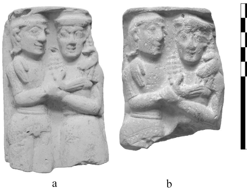
Fig. 2 - Rilievi con ierogamia. a) San Biagio, b) santuario urbano