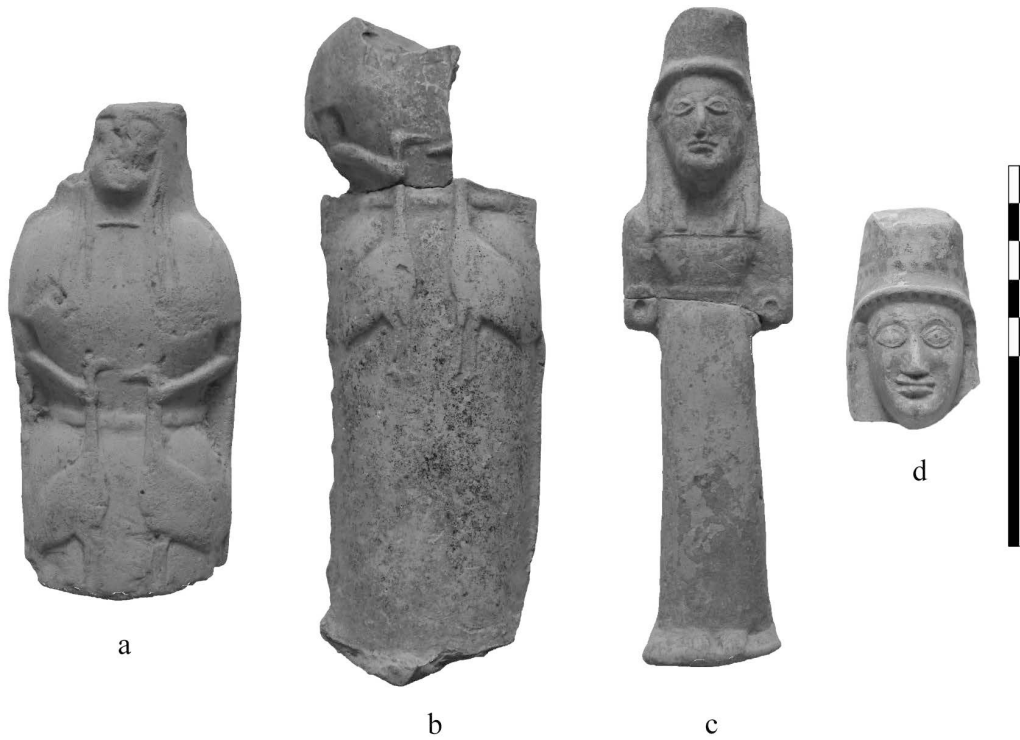
Fig. 3 - Potniai ornithôn e figure con gomiti "a mortassa". a-c) San Biagio, b) Heraion del Bradano, d: santuario urbano