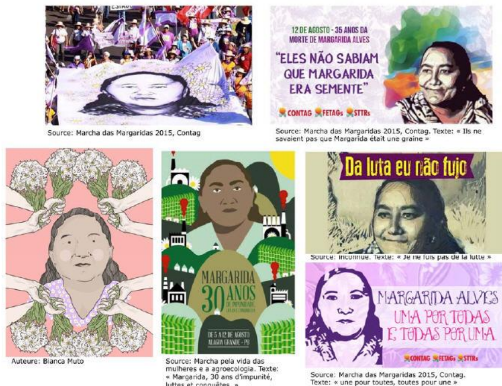
Figura 5. Exemplos de materiais ativistas com a imagem de Margarida Alves.

Margarida Alves expressa isto. A escolha desta "vítima" torna possível apontar o dedo ao agrocaptal como o culpado (Jasper 2016). No entanto, ela não é apenas uma vítima.