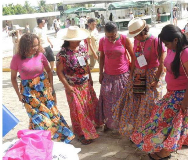
Figura 3. Ativistas do MMTR com saias de chita no IV Encontro Nacional de Agroecologia.