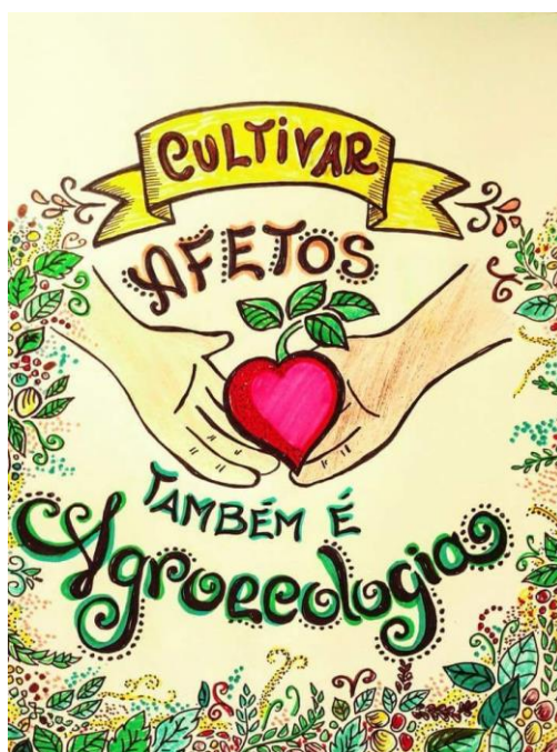
Figura 2. IV Encontro Nacional de Agroecologia, junho de 2018.

Fonte: desenho de Ricardo Wagner, oficina da mulher rural sobre a transição agroecológica