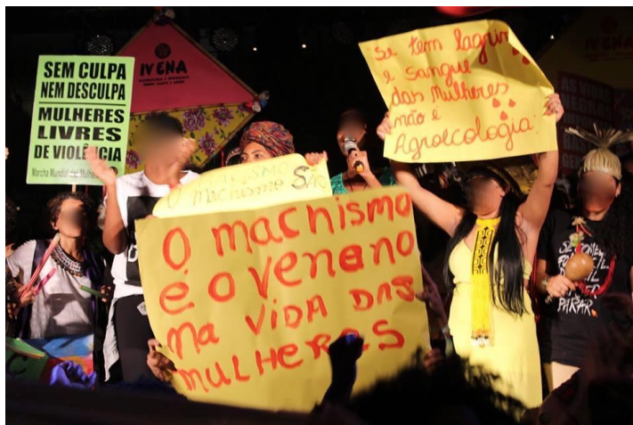
Figura 1. IVE Encontro Nacional de Agroecologia -2018.