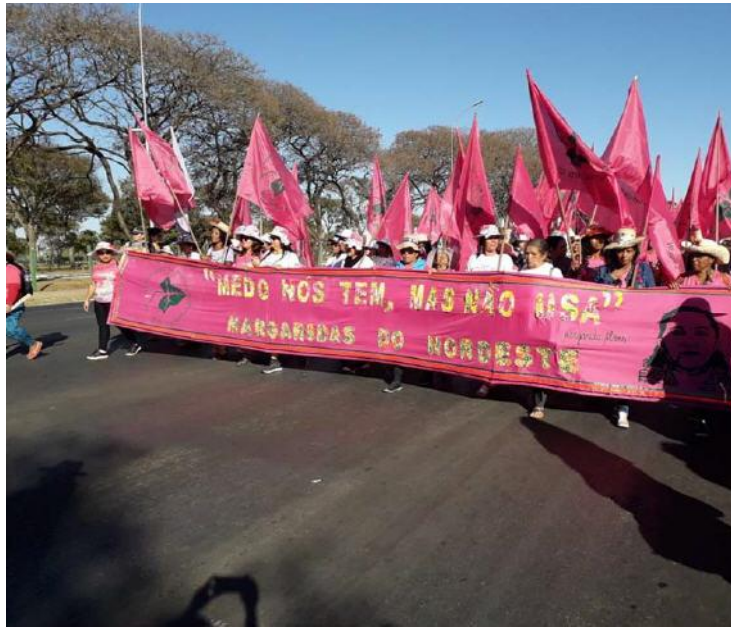
Figura 4. Bandeira MMTR-NE na MM 2019.