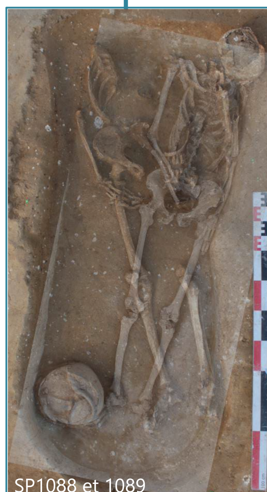
SP1088 et 1089

Agencement incinéré/inhumé : Contact direct entre le vase ossuaire et le pied de l'inhumé