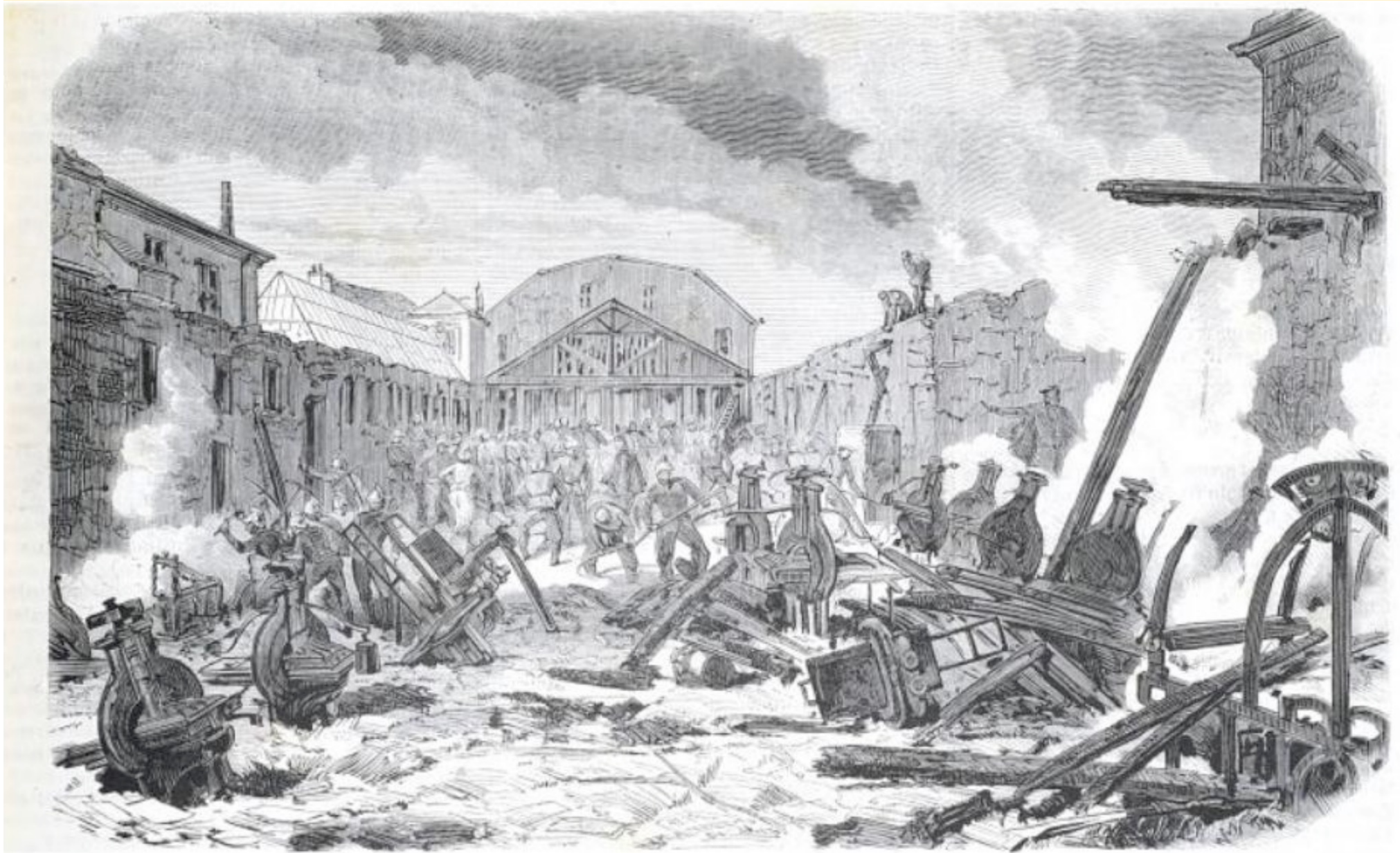
PARIS. — Incendie des ateliers catholiques de M. l'abbé Migne, à Montrouge.

Paris. — Incendie des ateliers catholiques de M. l'abbé Migne, à Montrouge. L'illustration , 22 février 1868