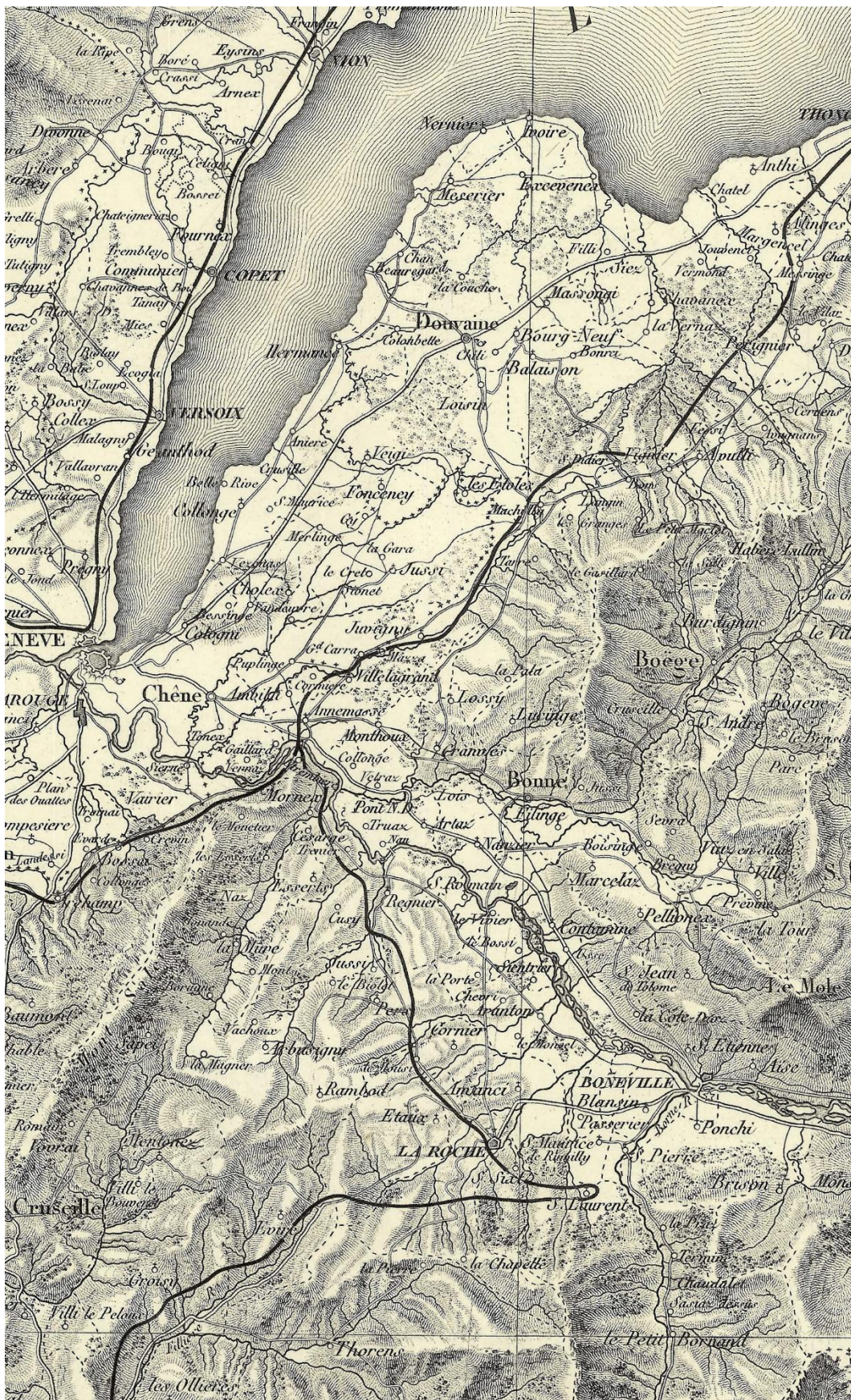
F1820/b. Les Alpes au 1:200 000 par Raymond, extrait exemplaire Extrait de la feuille n° I, Genève.