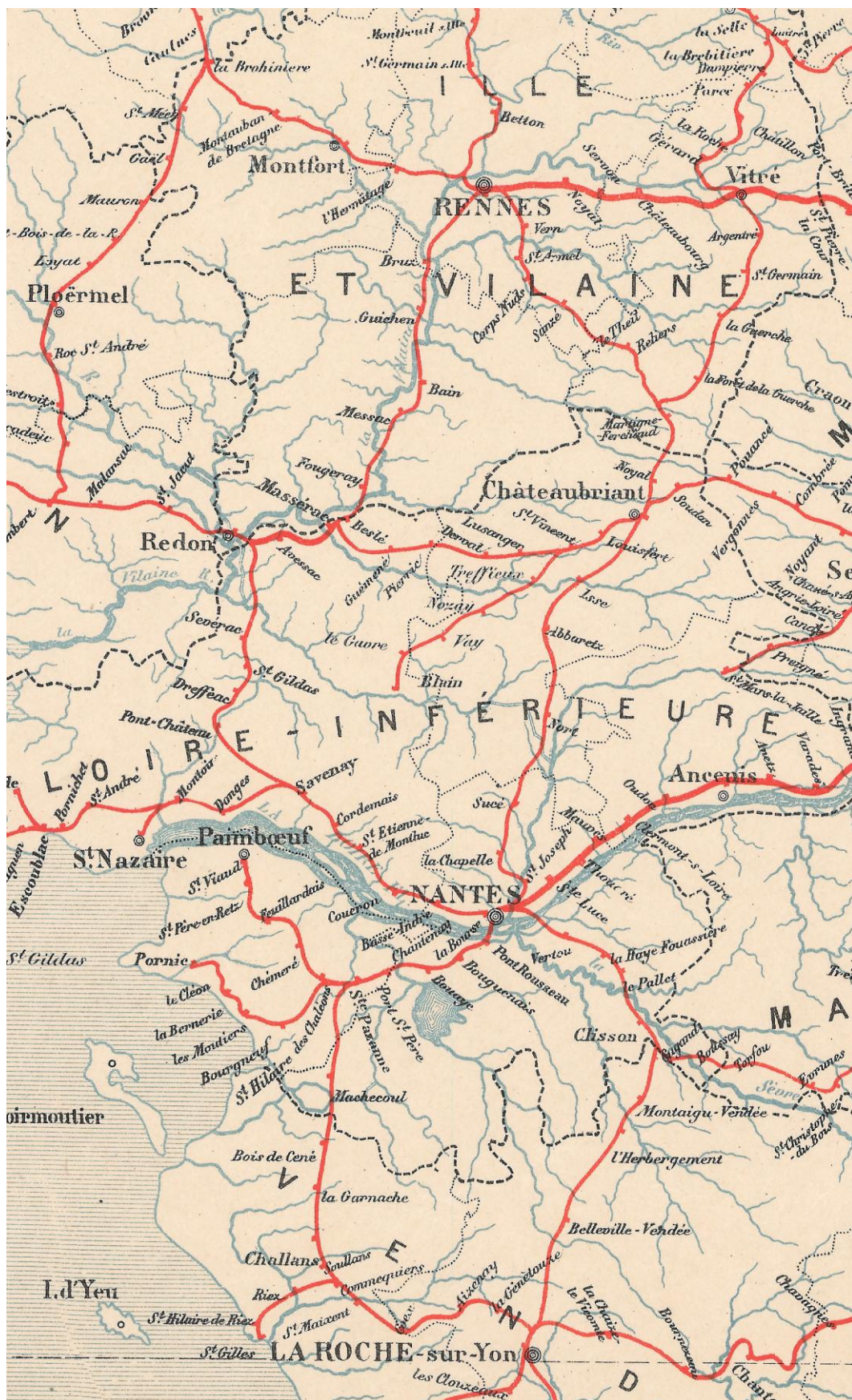
F1885/b. Carte des chemins de fer au 1:800 000, extrait exemplaire de la première édition

Extrait de la feuille n° 1, Paris, Service géographique de l'armée, 1885.