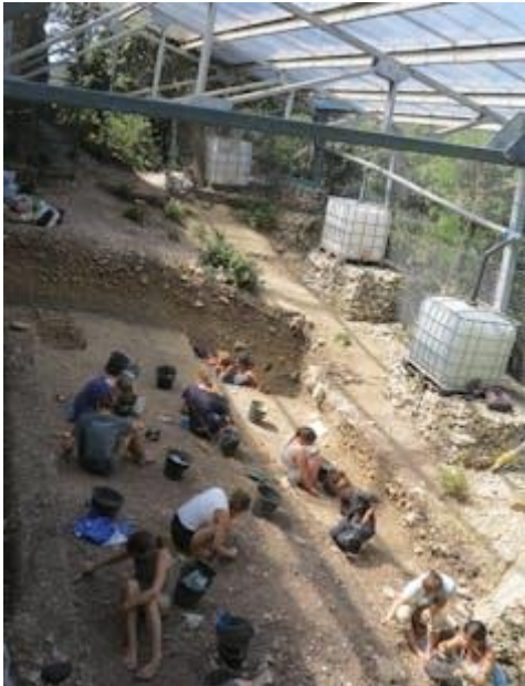
Imagen de las excavaciones en la entrada de la cueva Mandrin.

Este lugar, descubierto en 1960 y bautizado como “cueva Mandrin” en honor del héroe popular francés Louis Mandrin , ha sido un emplazamiento muy codiciado durante 100.000 años. Los artefactos de piedra y los huesos animales dejados por los antiguos cazadores-recolectores del periodo Paleolítico pudieron ser rápidamente recuperados gracias a la acción polvo glacial que fue arrastrado desde el norte por los famosos vientos mistrales, lo que permitió que dichos restos se mantuvieran en buen estado.