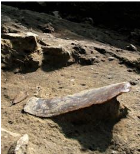
Imagen de una larga hoja de sílex que sobresale entre los sedimentos de la cueva de Mandrin.

Existen evidencias arqueológicas encontradas en Australia que demuestran que los humanos modernos llegaron a ese continente hace solo 65 000 años. Dado que es obvio que necesitaron barcos para cruzar el océano y llegar allí, no resulta descabellado pensar que los humanos de la región mediterránea disponían de la tecnología necesaria para la construcción de barcos hace 54 000 años, y que la usaron para explorar las costas de este mar, más fácilmente navegable.