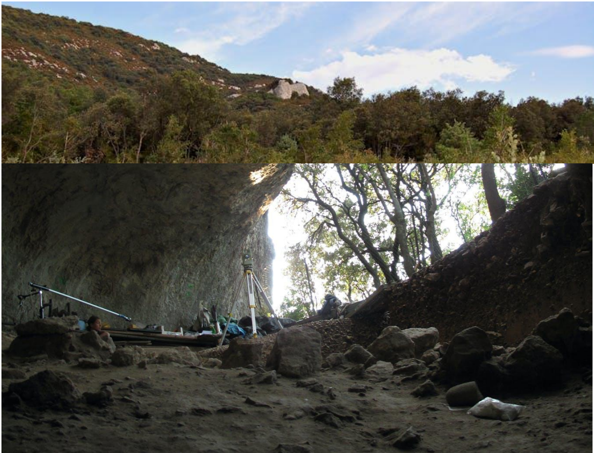
Vista desde lejos, la gruta Mandrin se asemeja a un simple saliente rocoso. Ludovic Slimak, CC BY-ND

Situado unos 100 metros sobre las laderas de los Prealpes del sur de Francia, hay un humilde refugio de piedra desde el que se domina todo el valle del Ródano. Se trata de un punto estratégico, dado que el río discurre a través de un estrechamiento que separa dos cadenas montañosas. Durante milenios, los moradores de este refugio de piedra disfrutaron de las vistas imponentes que componían las manadas de animales que emigraban desde la región mediterránea a las llanuras del norte de Europa... aunque hoy ese tráfico se haya visto sustituido por los trenes TGV y por un flujo de más de 180.000 vehículos diarios que circulan por una de las autopistas más congestionadas del continente.