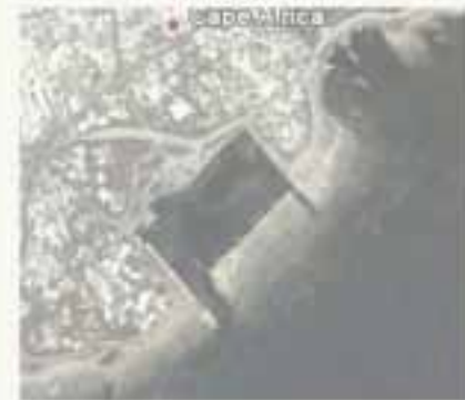
pl. I- Comparaison de la surface entre le port de Mahdiya (en bas) et celui supposé de Sousse (en haut) (Agnès Charpentier)