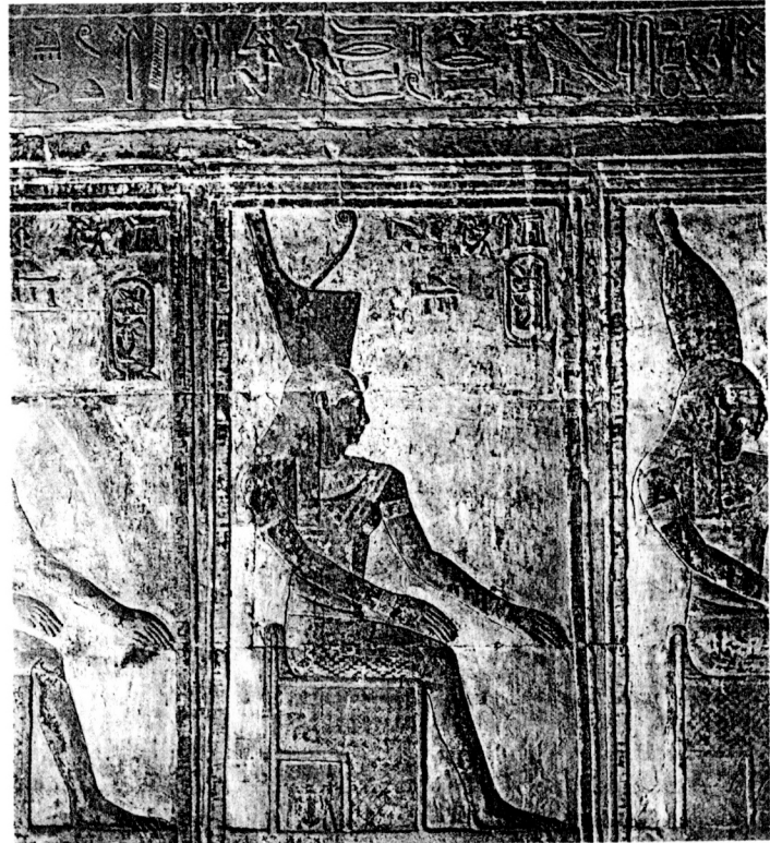
fig. 1 Statue d'un "roi de Basse-Égypte" dans son naos ; d'après Dendara II , pl. 105.

À l'époque ptolémaïque, deux types de fêtes peuvent être commodément distingués : les festivités destinées à la population grecque et hellénophone, à Alexandrie et dans les régions fortement hellénisées comme le Fayoum, et celles tournées vers la population égyptienne dans la chôra . Mais toutes ces fêtes ont en commun la place centrale accordée aux sorties processionnelles des statues des souverains lagides, Basileus macédonien et Pharaon égyptien.