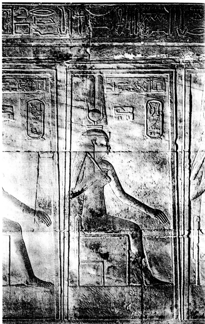
fig. 2 Statue d'une "mère royale" dans son naos. D'après Dendara II , pl. 106.

"Lieu d'asile selon les termes de l'ordonnance royale. Au roi Ptolémée et à la reine Cléopâtre appelée aussi Tryphaena , dieux Philopatôrs et Philadelphes, salut de la part d'Apollôphanès, fils de Bion, originaire d'Antioche, l'un des "premiers amis" et des chiliarques porteurs de lance. Il existe à Euhéméria, bourg de l'Arsinoïte, du district de Thémistos, un sanctuaire de Pso-naus, Pnéphéros et Soxis, dieux crocodiles, dans lequel sont aussi consacrés des portraits de vos ancêtres.