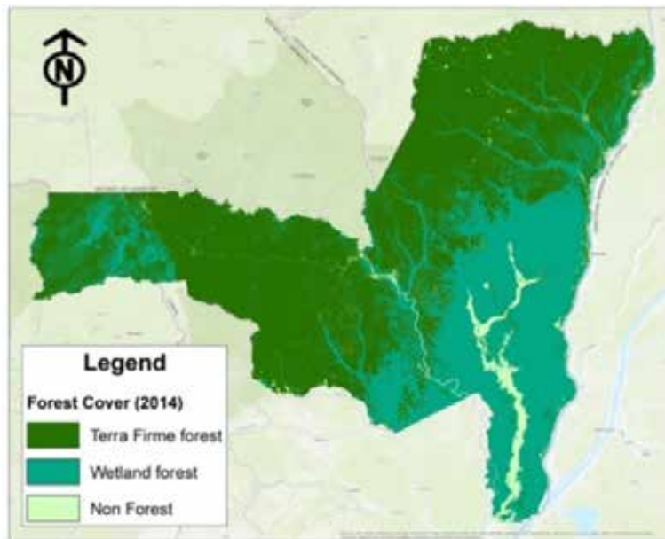
Figure 5.2: Carte du couvert forestier de la zone du ER-P Sangha Likouala

Tenant compte des incertitudes et risques d'inversion, les réductions d'émissions nettes seraient de l'ordre de 9 794 699 teCO 2 . Il convient de noter toutefois qu'il s'agit ici d'estimations provisoires : des travaux sont en cours pour affiner le scénario de référence, ce qui impactera le potentiel de réductions d'émissions nettes.