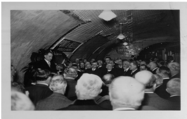
Fig. 5. Georges Marrane, président du Conseil général de la Seine, inaugure la station de métro Porte de Neuilly le 29 avril 1937

Georges Marrane est entouré de tous les notables de la ville bourgeoise de Neuilly-sur-Seine . Il n'est plus seulement le maire de la ville rouge, il est devenu un édile du Grand Paris, reconnu de ses pairs.