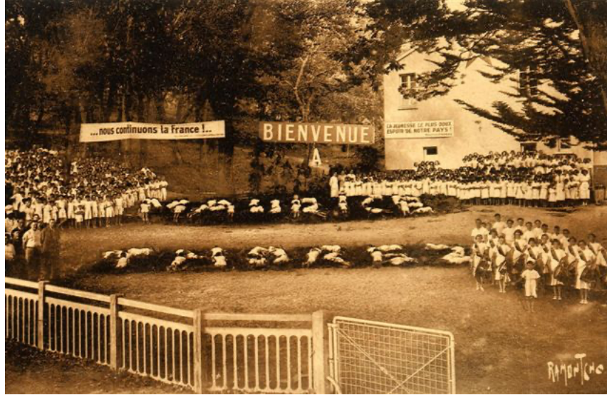
Maurice Thorez est à gauche en chemise blanche, manches retroussées. Des enfants se sont allongés pour former les lettres « Maurice Thorez » et lui souhaiter la « Bienvenue.