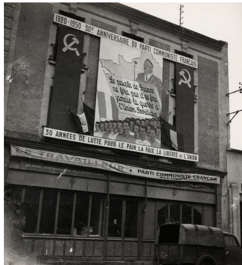
La façade de la section d'Ivry et des bureaux du journal local Le Travailleur est à l'effigie de Maurice Thorez déclarant : « Le peuple de France ne fera pas la guerre à l'Union soviétique ».