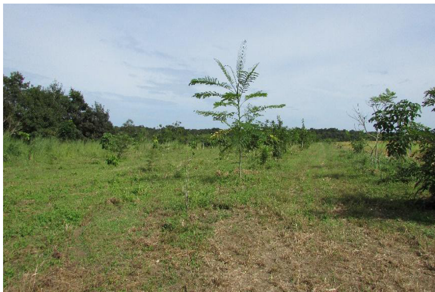
Figura 4 – Área de APP cujo plantio foi iniciado em 2011, em estágio médio de restauração em Lucas do Rio Verde (MT). Na parte esquerda, a vegetação nativa da APP; no meio: o plantio na APP desmatada; à direita: a lavoura.

rurais, notamos uma grande variabilidade de resultados de um município para outro e de uma propriedade para outra. Em geral, temos visto relativamente poucas APPs apresentando um estágio muito avançado de RAD (Figura 3) nas visitas realizadas em 2016 e 2017, em contraste com o discurso de seus donos, que muitas vezes nos explicaram “ter feito sua parte” e que “o assunto est[ava] resolvido”, contando com a regeneração natural para terminar o trabalho (Figura 4). Também notamos que as APPs apresentando maior desempenho foram geralmente as que receberam mais visitas de instituições nacionais e internacionais. De fato, encontramos às vezes resultados diferentes entre as propriedades aconselhadas pelas secretarias e as que selecionamos ao acaso (Figura 5).