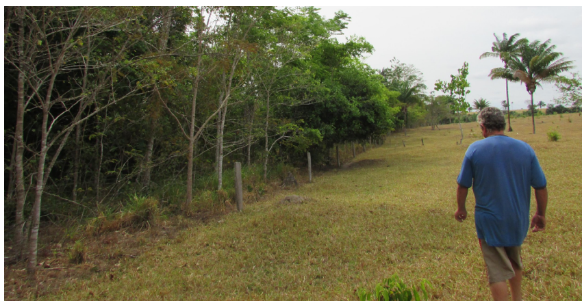
Figura 3 – Exemplo de uma APP em estágio avançado de recuperação (plantio realizado em 2011), em área de pastagem, município de Alta Floresta (MT).

A diferença entre o planejado e o implementado se deve principalmente ao fato de que embora o projeto original tivesse previsto cercas a 30 metros dos leitos dos rios, muitos proprietários de terras destacaram as novas regras da reforma do Código Florestal e, conseqüentemente, cercaram seus APPs mais perto dos leitos, reduzindo assim seus tamanhos e, portanto, as áreas a serem restauradas. No entanto, precisamos ressaltar o fato de que mesmo que a lei tenha diminuído as exigências de recomposição, percebemos em campo, e conversando com os principais atores envolvidos nas iniciativas, que a maioria dos proprietários cercou além do mínimo previsto pela nova lei.