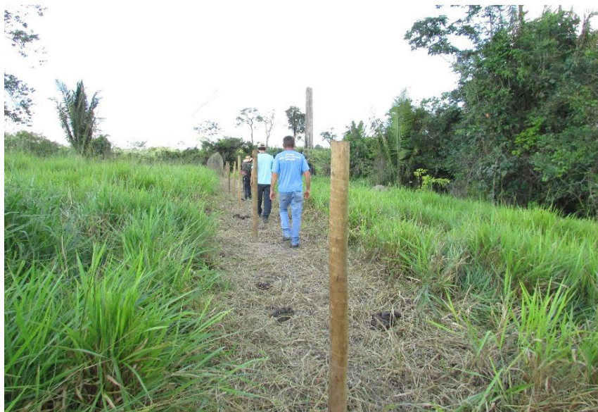
Figura 2 – Instalação de palanques de eucalipto doados pela prefeitura de Cotriguaçu (MT) para cercar uma APP em área de pastagem.

vezes simplesmente mobilizaram os seus funcionários), e já que não precisaram cercar suas APPs em função da predominância de atividades agrícolas.