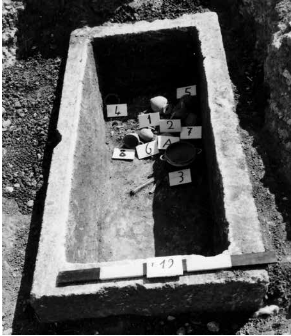
Fig. III.1.1 : Le sarcophage P 19 de Mégara Hyblaea (EFR).

tion de ces dépôts : la position originelle des défunts, le nombre de remaniements dont ils ont fait l'objet, l'ordre et éventuellement le temps écoulé entre ces manipulations, toutes ces informations ne peuvent être appréhendées sans une analyse minutieuse de la stratigraphie du dépôt et de la disposition relative des ossements et du mobilier en contexte. Ce type d'approche a par exemple permis de comprendre des dépôts particulièrement complexes, comme les grandes fosses communes relatives aux deux grandes batailles d'Himère au v e siècle av. J.-C., dans lesquelles l'agencement des plusieurs dizaines de corps reflète l'issue tragique de la bataille de 409, cruellement sensible à l'extrémité de la fosse par l'empilement désordonné des cadavres (fig. III.1.2) qui contraste avec leur agencement soigné dans les fosses de 480 26 . L'analyse archéothanatologique permet ainsi d'entrevoir dans les pratiques funéraires le soin, ou au contraire l'urgence, la précipitation ou le mépris dans la gestion du cadavre, touchant du doigt une archéologie des émotions encore largement à écrire.