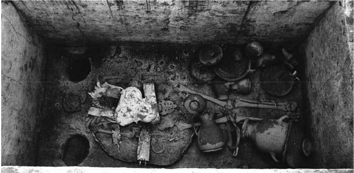
Fig. III.1.4 : Nécropole de Gaudo, tombe 197 en cours de fouille (d'après Cipriani 2000, fig. 15, p. 209).

nécropoles où l'on retrouve de plus en plus d'indices des cérémonies qui pouvaient avoir lieu au moment des funérailles et lors de commémorations ultérieures. La présence d'un nombre considérable de fragments de vases (entièrement remontables) dans les niveaux de circulation de la nécropole de Santa Venera a par exemple amené Marina Cipriani à supposer une fragmentation intentionnelle et rituelle des vases à la surface des tombes 34 . La présence de nombreux vases à boire (notamment une cinquantaine de cratères) suggère une consommation rituelle de vin sur les tombes, peut-être dans le cadre de pratiques liées au banquet funéraire. L'existence de cérémonies effectuées après la fermeture des tombes à Paestum est également documentée par la découverte des restes d'un animal sacrifié sur la couverture d'une tombe du IV e siècle av. J.-C. de la nécropole de Licinella 35 , ou encore par le petit amas de résidus de bûcher placé sous un skyphos retourné sur la couverture de la tombe 181 de la nécropole de Santa Venera 36 . Des pratiques similaires ont été documentées à Himère où plus de 70 petits dépôts d'os animaux et d'objets brûlés