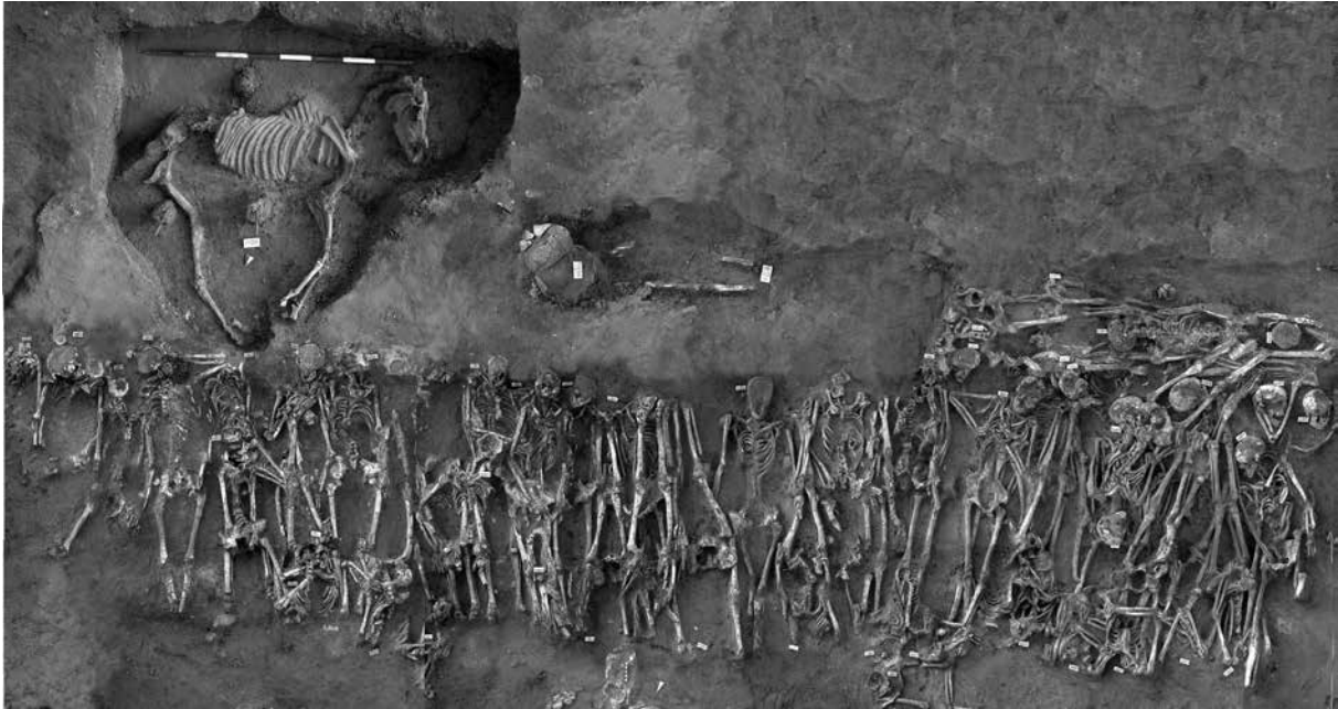
Fig. III.1.2 : La fosse commune de 409 av. J.-C. à Himère. Voir cahier central.

primaire et du dépôt secondaire, unis dans une même structure tombale 28 .