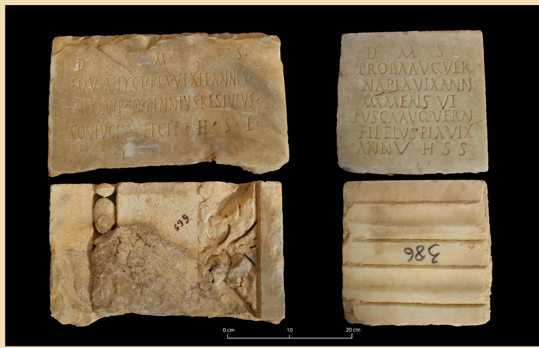
CIL, VIII, 12737 et 13112 (conservées au musée de Carthage) mettant en évidence le remploi de supports.