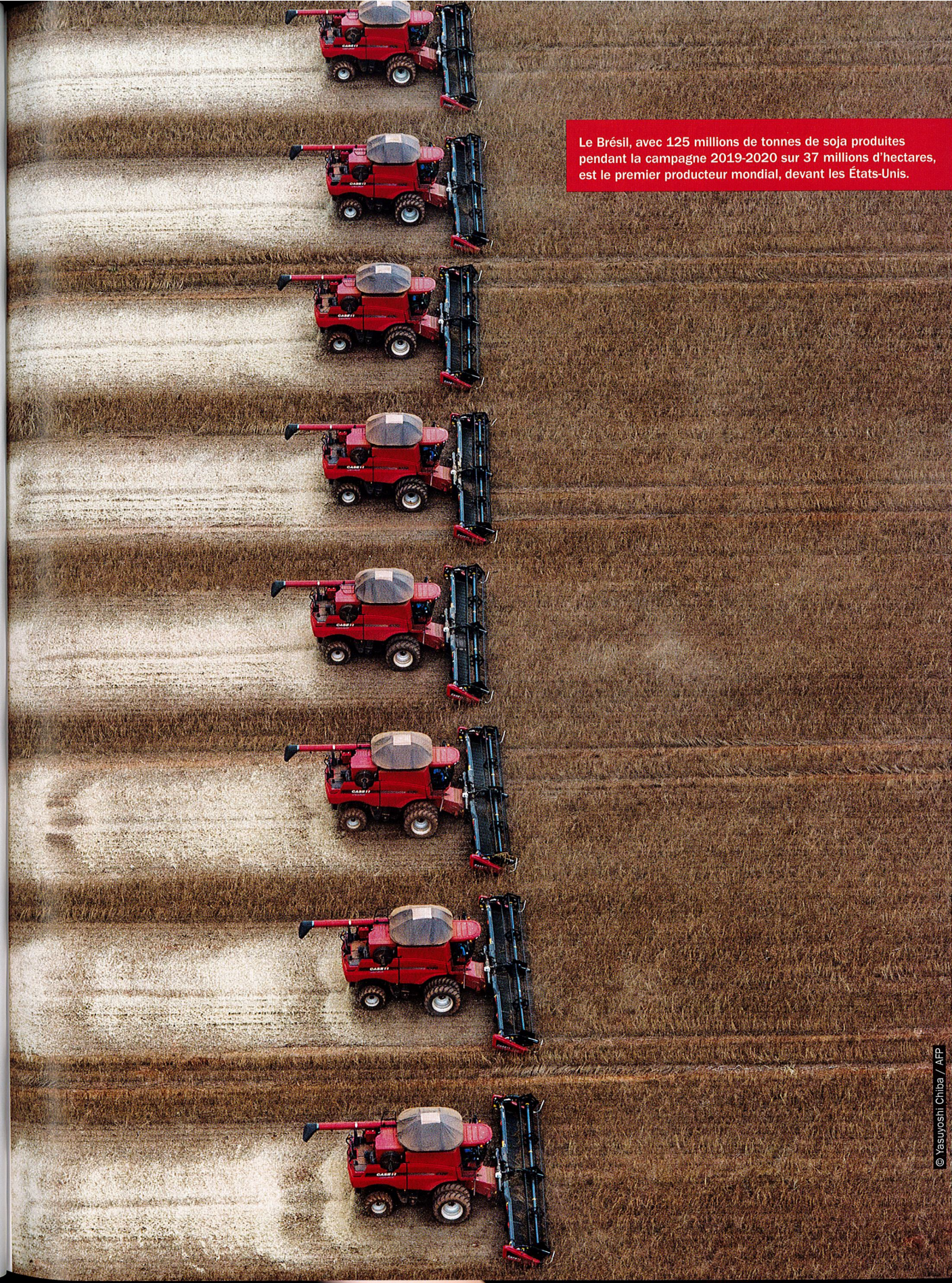
Le Brésil, avec 125 millions de tonnes de soja produites pendant la campagne 2019-2020 sur 37 millions d'hectares, est le premier producteur mondial, devant les États-Unis.