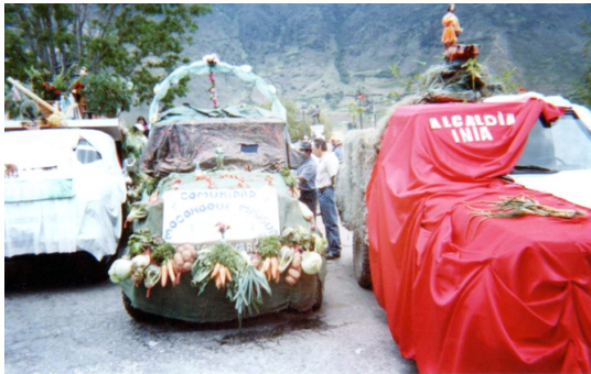
Photo participative 5. Char de la communauté pour la fête de San Isidro/ Guillermina Albarrán/ Mucuchies, Mérida.