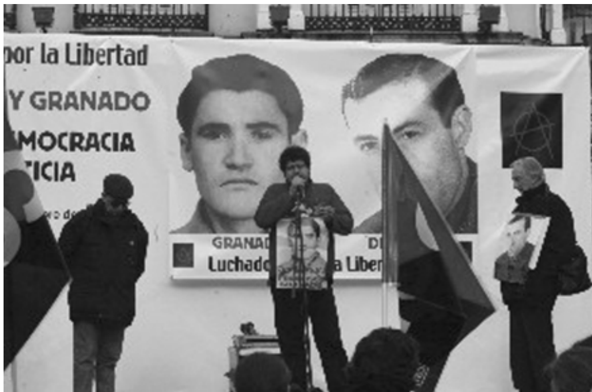
Meeting tenu à Madrid le 6 décembre 2003, place Puerta del Sol, pour demander — en ce jour anniversaire de la constitution — l'annulation des sentences prononcées par les tribunaux franquistes.

Le 29 juin 1990, est enfin promulgué la loi 4/1990 pour régler les indemnisations à tous ceux qui furent emprisonnés dans les prisons franquistes (« pendant plus de trois ans et ayant 65 ans au 31 décembre 1990 »). Par la suite, les associations d'ex-prisonniers politiques continuèrent à se mobiliser pour améliorer ces conditions d'indemnisations ou pour augmenter leur montant, lesquelles, dans certains cas, étaient misérables.