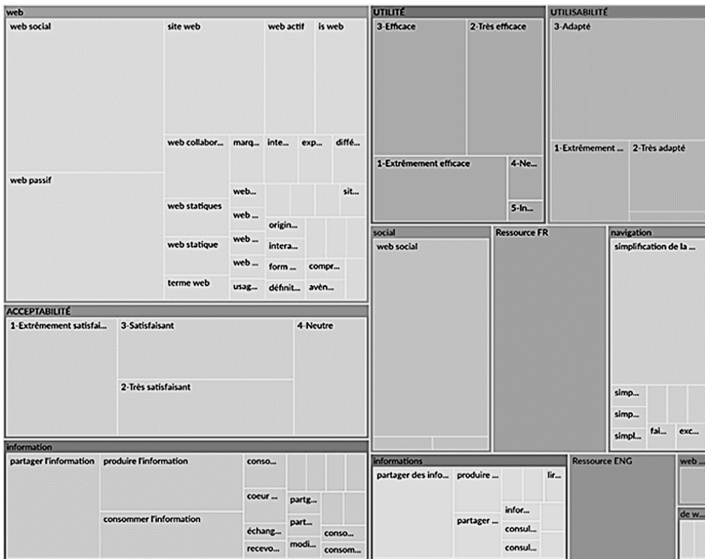
Figure 3: Diagramme hiérarchique comparé par nombre de références d'encodage

A la fin de cette étape, le logiciel peut ensuite générer différents types de graphiques, par nombre d'éléments encodés et par références d'encodage, par exemple la génération par comparaison de critère associé au type de ressource. La génération par « diagramme hiérarchique » permet, elle, de visualiser l'ensemble des éléments sous forme de tuiles, à la fois ceux encodés manuellement à partir des indicateurs, ainsi que tous les termes récurrents présents dans les documents textuels produits et codés automatiquement, permettant de faire émerger des thèmes préférentiels dans les usages comme en figure 3 :