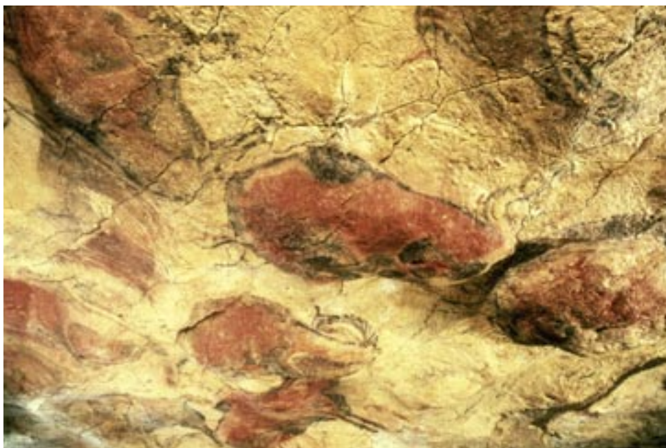
Abb. 11 Große Decke der Höhle von Altamira, Santillana del Mar (Cantabria). Polychrome Bisonsdarstellungen.