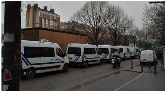
2.3. Présence policière lors de l'évacuation du campement de l'Avenue du Pr. Wilson le 25 janvier 2019.