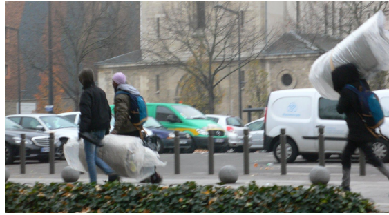
2.1. Des habitants du campements de l'Avenue du Pr. Wilson à Saint Denis cachent leurs tentes et leurs affaires au petit-matin.