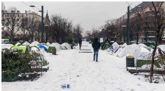
2.2. Le campements de l'Avenue du Président Wilson s'étend, janvier 2019.