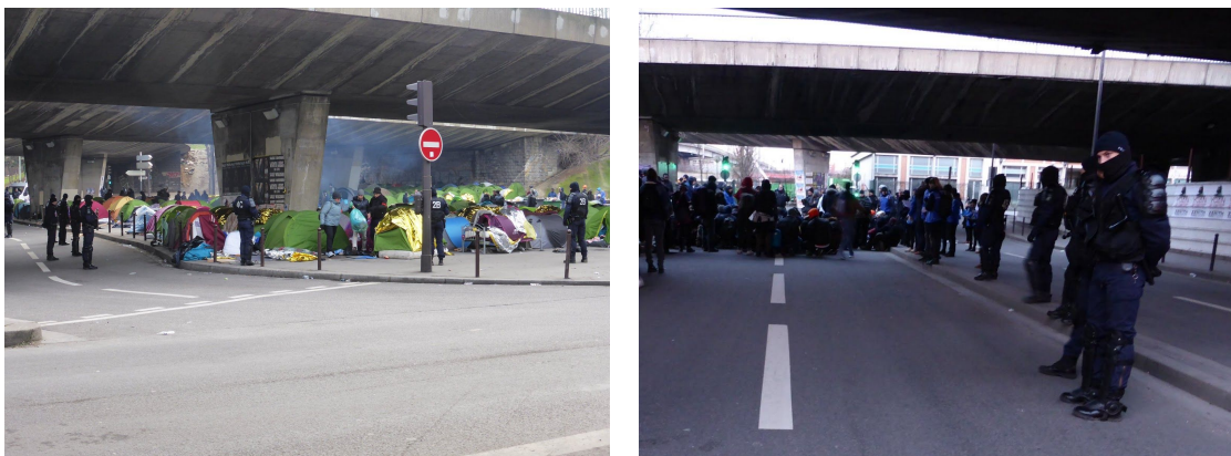
Figure 3 : Evacuation de Porte de la Chapelle.

social et spatial, les procédures d'évacuation figurent parmi les actions publiques les plus récurrentes (Viala et al, 2016) et celles-ci s'exercent dans des temporalités courtes et répétitives.