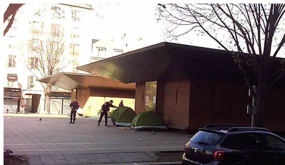
2.4. La police vient réveiller les habitants du campement au matin pour leur demander de partir au début du mois de mars 2019.