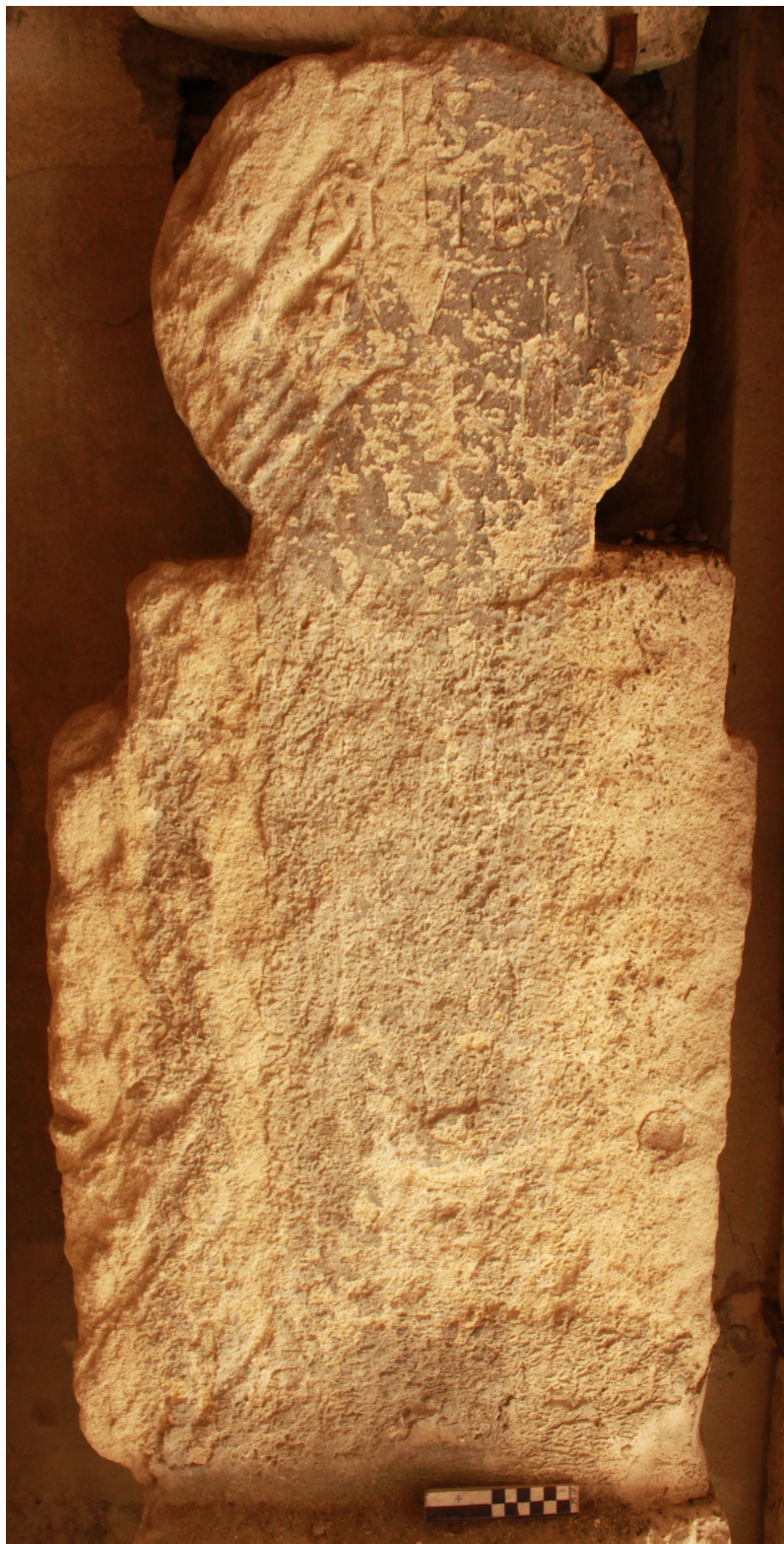
Figure 1 : inscription de Marcus Aucus Macrinus, Montélimar, cliché B. Rossignol.