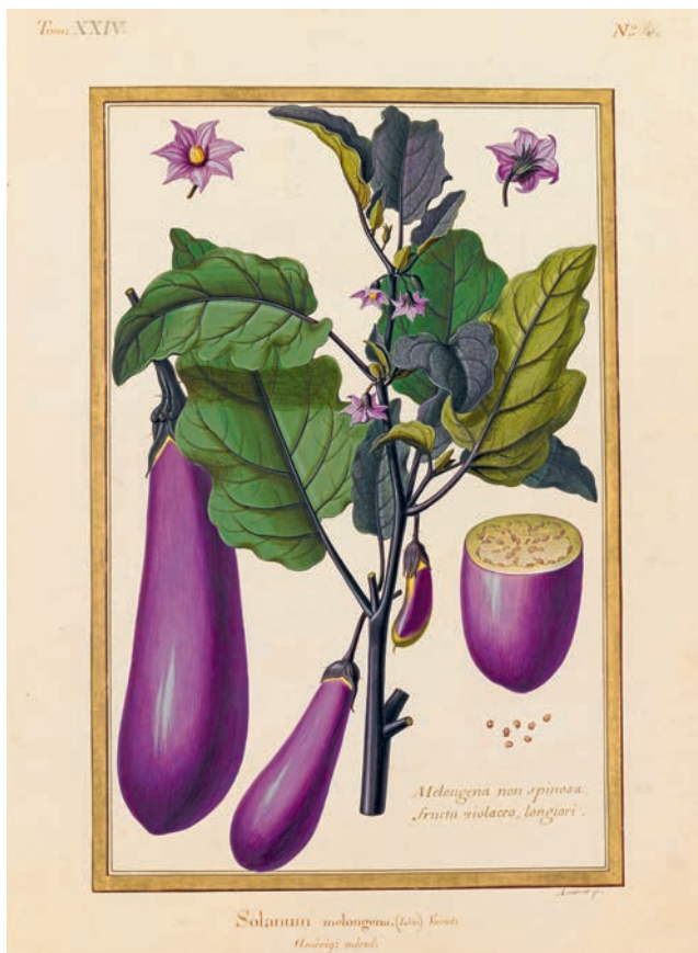
Aubergine, Solanum melongena (Lin.), XVIII e siècle, aquarelle de la collection des vélins du Muséum national d'histoire naturelle.

Aujourd'hui, les particularismes des nouveaux régimes diététiques incluent de nouvelles ou d'anciennes plantes: graine de chia, quinoa, petit épeautre (blé engrain), huile de caméline et de chanvre, etc. Les anciennes espèces exotiques lointaines ou voisines sont devenues des ingrédients communs, incontournables des recettes traditionnelles du patrimoine alimentaire selon les goûts et les cultures, qui ont parfois modifié les façons de les consommer. Et cela reste vrai pour les viandes. Pas de mouton en Europe occidentale avant le début du Néolithique, pas de poulet avant le temps des Gaulois, pas de lapin avant le Moyen Âge, pas de canard de Barbarie avant la découverte des Amériques, où il a été domestiqué, loin de nos canards colverts restés cantonnés à la rubrique gibier dans notre patrimoine alimentaire.