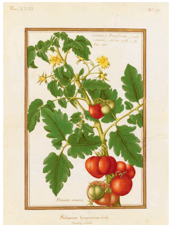
Tomate, Solanum lycopersicum (Lin.), XVIII e siècle, aquarelle de la collection des vélins du Muséum national d'histoire naturelle.

Avant et au cours du Moyen Âge, nombre de ces plantes mises en culture se diffusent en France dans les nouveaux jardins et vergers seigneuriaux parallèlement aux créations variétales issues des sélections locales. Au cours de ce millénaire, troisième temps d'innovation, cinq espèces à grains farineux entrent dans la base alimentaire paysanne. Le seigle et l'avoine, auparavant discrets, se déploient à partir des VII e -VIII e siècles. Suivent l'avoine sableuse, une céréale venue de Scandinavie au