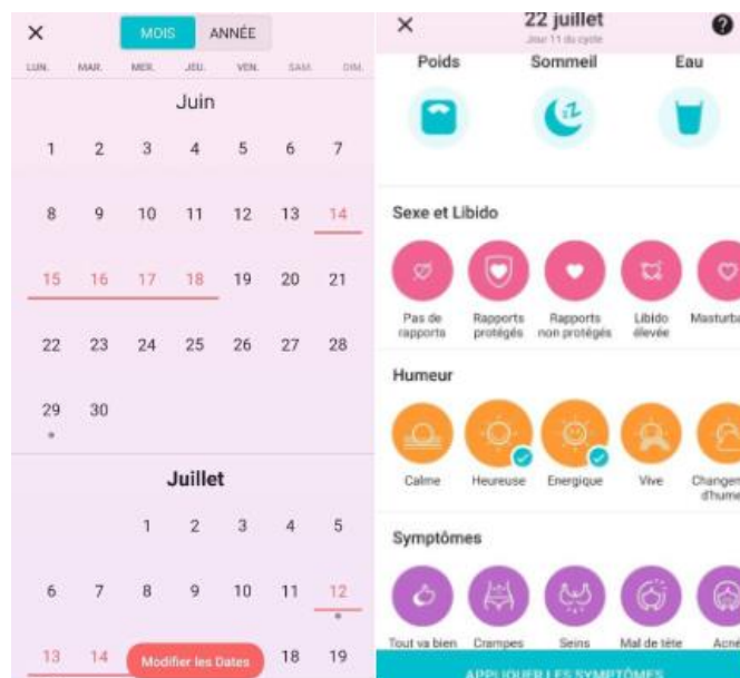
Figure 5 : L'ajout d'informations hétérogènes au « calendrier » de l'application Flo sur lesquelles repose une position topologique

Cet usage caractéristique du calendrier est bien décrit par Lise à propos de Flo :