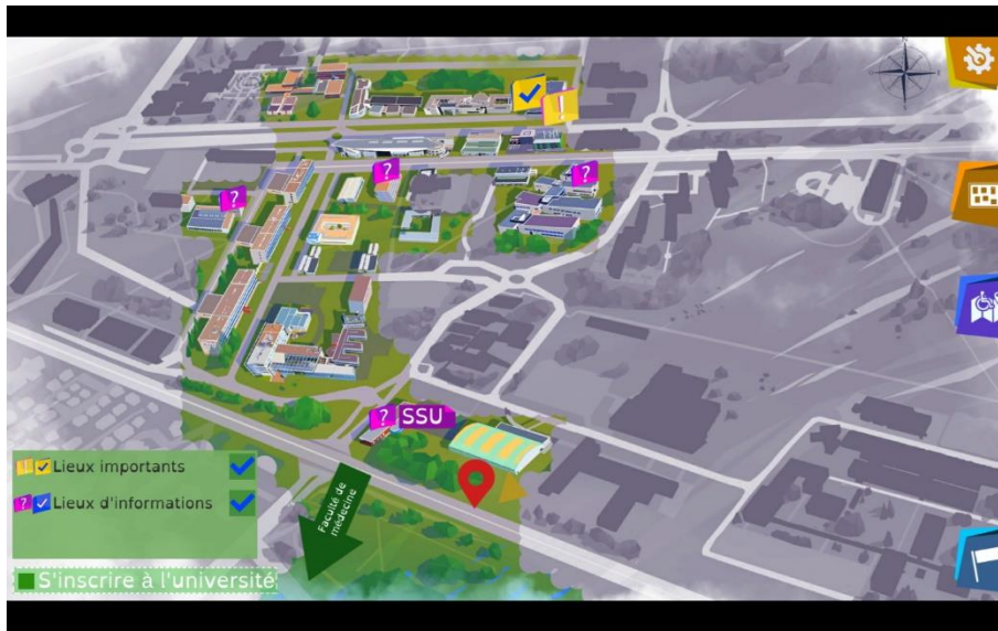
Figure 2 : Carte générale du campus utilisée pour se déplacer. En couleur les zones connues, en grisé le « brouillard » recouvrant les zones inexplorées se lève à l'approche du joueur.

Le deuxième point de design consiste à ponctuer la progression d'énigmes à résoudre lors des déplacements sur le campus. Le joueur collecte progressivement des indices qu'il doit organiser pour progresser dans le jeu et ainsi il se construit une représentation surplombante du campus, il construit progressivement sa propre cartographie de cet espace de vie comme la capture d'écran suivante le montre.