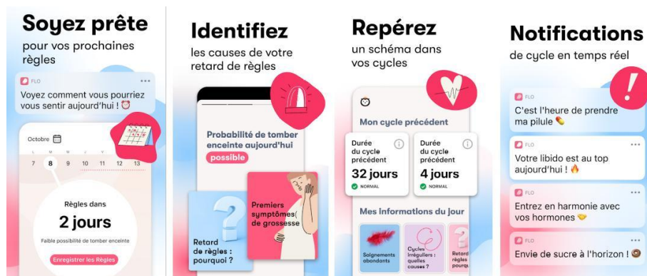
Figure 3 : Présentation de l'application Flo sur le PlayStore de Google

Les concepteurs valorisent l'empowerment des femmes par une meilleure connaissance de leur corps. Cette nouvelle offre de technoservices (Clarke et al., 2000) enchevêtre des idéaux féministes d'émancipation avec l'information médicale, les technologies numériques quotidiennes et l'expérience d'un corps sexué. C'est ici par des pratiques de surveillance et de contrôle du corps que l'utilisatrice produit des connaissances.