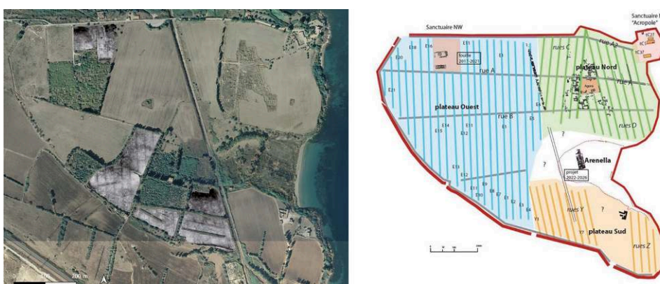
Fig. . Vue d'ensemble du site de Mégara Hyblaea avec les zones ayant fait l'objet de prospections géophysiques et schéma de la trame urbaine mise à jour avec les données des missions 2021.

Fond : Google Map, prospections : Geocarta ; schéma : H. Tréziny.