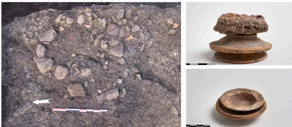
Fig. 5. Foyer en cours de fouille et dépôt votif d'un kalathos et d'un pied de coupe ionienne dans la cour du lot 114E4.