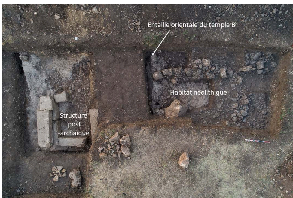
Fig. 6. Le sondage 2.1 en fin de fouille avec la structure post-archaïque à l'ouest et la structure préhistorique absidale à l'est.