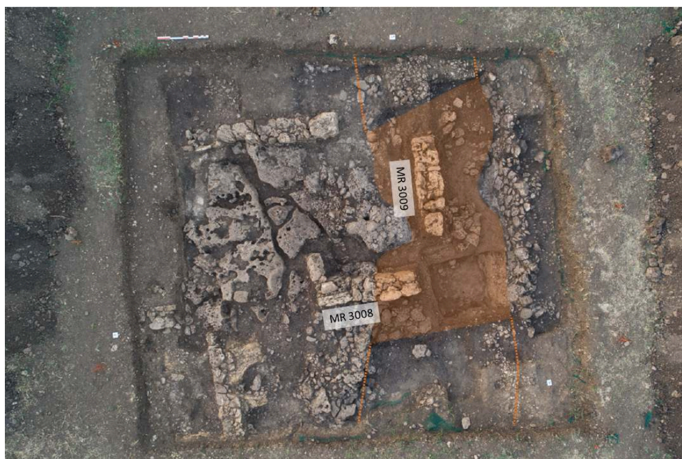
Fig. 3. Le sondage 1_2021 en fin de fouille, montrant la superposition des murs grecs archaïques sur les niveaux et le fossé néolithiques (en orange).