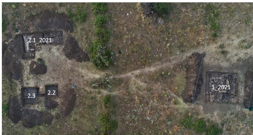
Fig. 2. Localisation des sondages 2021.

campagne prévue au printemps 2020 en raison de la crise sanitaire, quatre sondages ont été ouverts en 2021 (fig. 2).