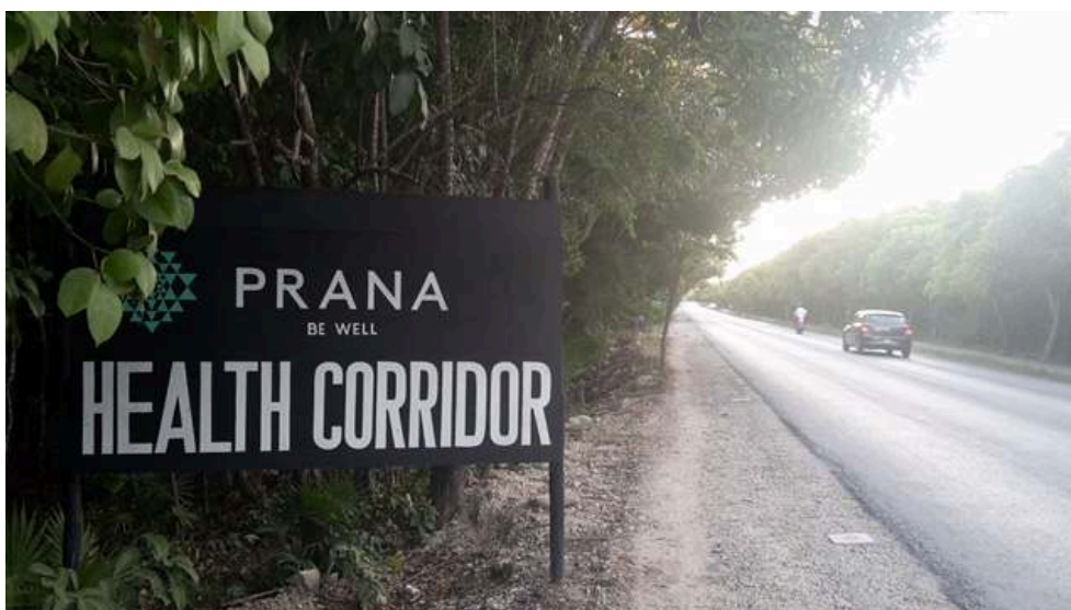
Illustration 2. Panneau publicitaire utilisant la santé comme argument promotionnel