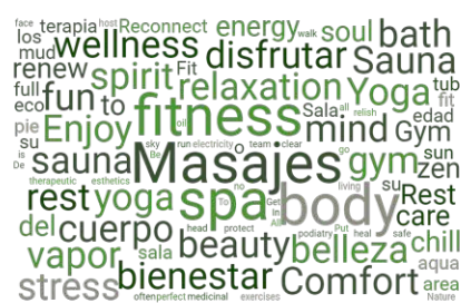
Figure 1. Nuage de mots des termes relevés appartenant au champ lexical de la santé et du bien-être