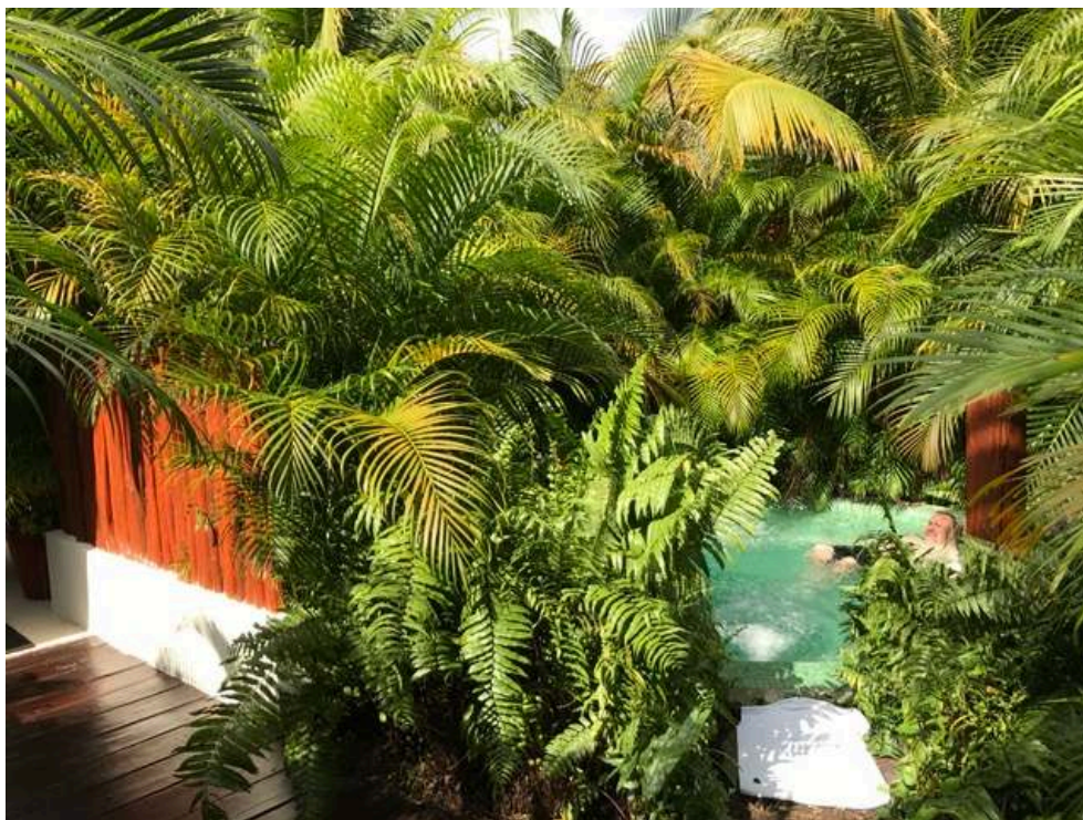
Sébastien Fleuret, 2019.

Illustration 1. Photo d'un espace de détente d'un hôtel de type resort de la Riviera Maya