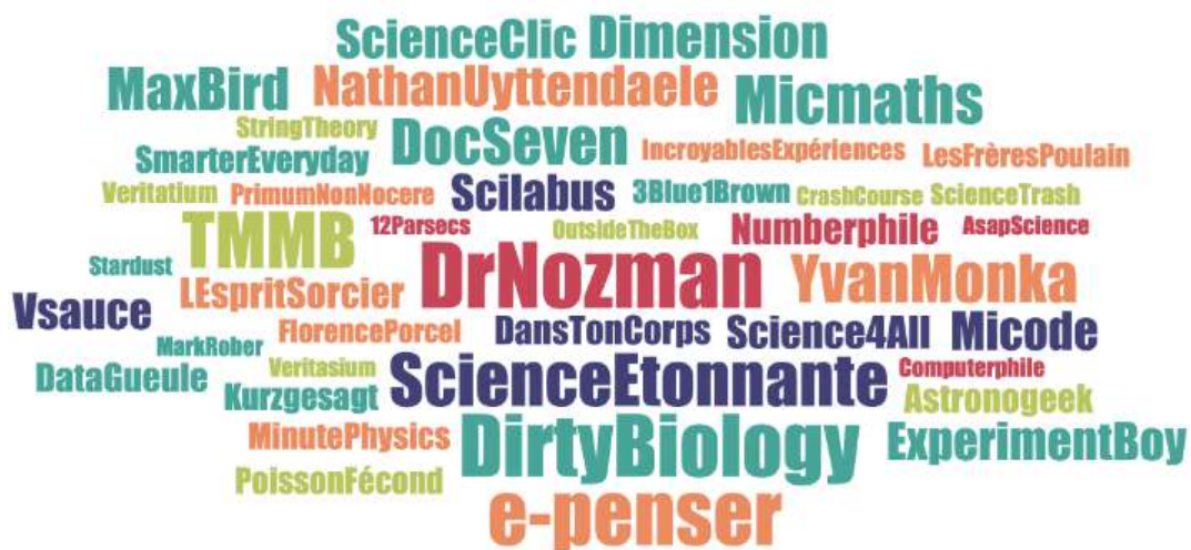
Figure 1 – YouTubers scientifiques les plus cités par les jeunes interviewés

La taille du nom correspond à la fréquence de citation, Dr Nozman étant le plus cité avec 22 occurrences. Nathan Uyttendaele est cité pour les 2 chaînes qu'il a tenues (La statistique expliquée à mon chat/Chat Sceptique). TMMB = Tu mourras moins bête.