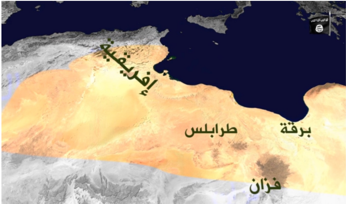
Fig. n°4. Carte de la conquête du Maghreb à l'époque de 'Uthmān b. 'Affān. Capture d'écran d'une vidéo de la Wilāyat al-Baraka, État islamique, janvier 2016

Les séquences de combat en Syrie laissent place à des extraits de films à succès comme la série qatari-saoudienne ou à des passages du siège de Jérusalem dans Kingdom of Heaven . L'ensemble s'emmêle à un rythme rapide. Les deux époques (soit celle de la guerre mythique, atemporelle et celle de la période contemporaine) sont indistinctes car elles sont considérées comme similaires.