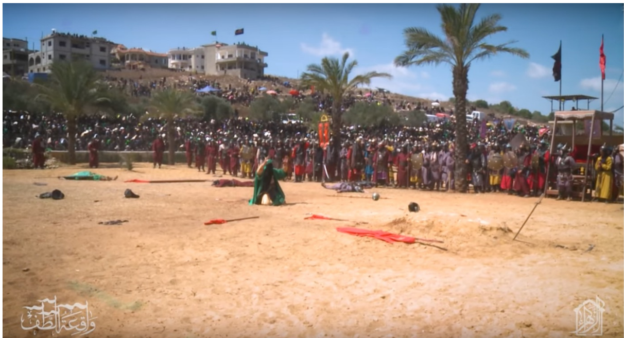
Fig. n°1. Représentation théâtrale du martyr d'al-Ḥusayn. Capture d'écran d'une vidéo YouTube.

En Iran comme en Irak, ces représentations de la bataille sont désormais filmées et diffusées sur YouTube . L'action se couple à la récitation d'élégies et à des échanges entre les protagonistes, dont les discours sont extraits des sources médiévales. Les textes proclamés par l'imam et ses partisans sont souvent chantés et visent à exalter l'assemblée. À l'inverse, lorsque les troupes omeyyades prennent la parole, elles le font en criant, avec brutalité et sauvagerie.