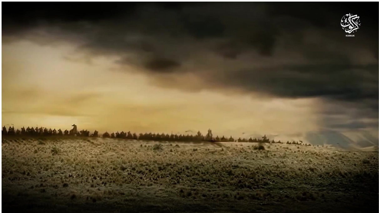
Fig. n°1. Réutilisation d'extraits du film The Lord of the Ring. Capture d'écran d'une vidéo de la Wilāyat Kirkuk, État islamique, mai 2018

rechigne donc pas à alimenter ses vidéos d'images de films américains médiévalistes dans la mesure où les productions hollywoodiennes font l'objet d'une coranisation du discours. Souvent placées en arrière-plan, elles occupent l'espace visuel tandis que la bande-son est dédiée à une lecture du Coran ou à la diffusion d'un nashīd (pl. anāshīd ) (Velasco-Pufleau 2018). Le spectateur perd donc tout contact avec l'univers initial du film pour plonger dans celui d'une guerre fantasmée, atemporelle, où le sabre occupe une place prééminente, le tout baigné dans une ambiance sacralisée par les chants.