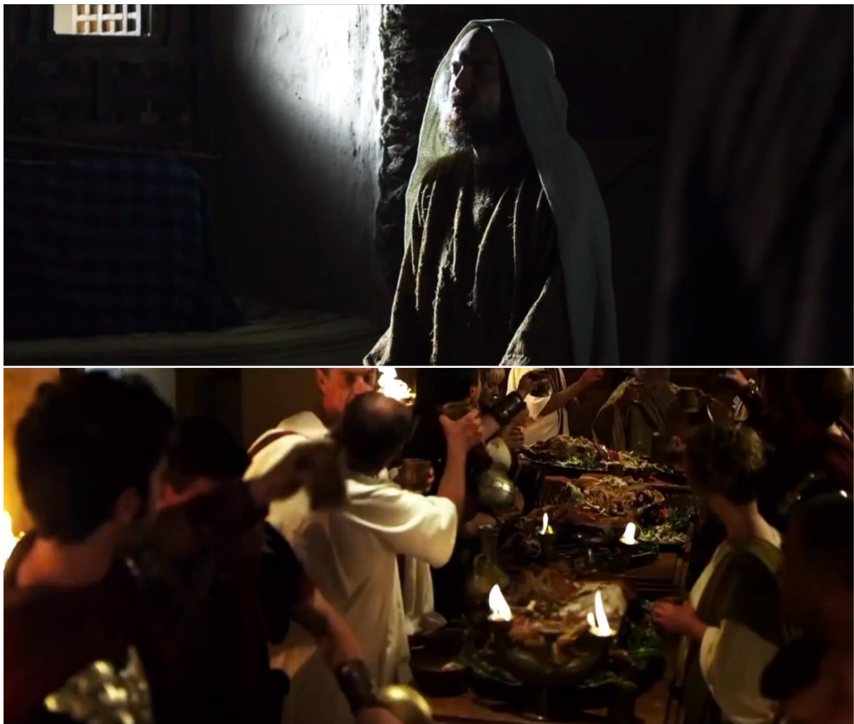
Fig. n°2. Du palais de Chosroès à la maison de 'Umar. Capture d'écran de la série 'Umar al-Fārūq

En outre, les réalisateurs usent à souhait de la technique du fondu, permettant d'opposer la richesse des palais byzantins et perses dans lesquels sont reclus des empereurs repus de richesses à la frugalité de la demeure de 'Umar.