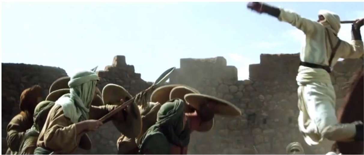
Fig. n°1. Waḥshī au combat contre Musaylima. Capture d’écran de la série ‘Umar al-Fārūq

Un second temps est dédié aux guerres d’apostasie ( ḥurūb al-riḍḍa ), qui marquent le règne d’Abū Bakr. À mesure que les dignitaires de La Mecque se rallient, les tribus apostasient autour de quelques chefs locaux. La série s’arrête en particulier sur le combat entre Khālīd b. al-Walīd et Musaylima dans la Yamāma durant lequel se distingue l’affranchi Waḥshī, dont la force est décuplée par son entrée dans l’islam. Quelques gros plans et ralentis individualisent son héroïsme et sont mis au service d’une magnification de l’art du combat.