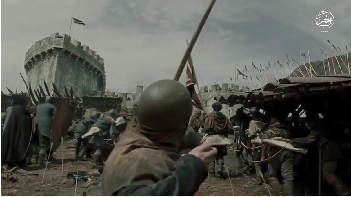
Fig. n°2. Réutilisation d'extraits de Robin Hood. Capture d'écran d'une vidéo de la Wilāyat al-Khayr, État islamique, octobre 2017

Au milieu de ces références à des blockbusters américains, on retrouve également des images de séries directement liées à l'histoire de l'expansion de l'islam. C'est le cas par exemple de la série 'Umar al-Fārūq , dont des passages apparaissent dans une vidéo de la wilāyat al-Raqqā datée de septembre 2017. Par ailleurs, l'organisation n'hésite pas non plus à user de visuels cartographiques rappelant l'histoire de la diffusion de l'islam telle une tâche d'encre depuis Médine jusqu'aux plateaux sassanides du Khurāsān. Partant, les djihadistes établissent une filiation directe entre leur combat et celui des Compagnons de l'époque du Prophète et des premiers califes. Le récit des grandes conquêtes islamiques de Syrie, d'Irak et des plateaux d'Asie centrale est mis en image pour célébrer ces guerriers qui se voient marchant dans les pas de Khālīd b. al-Walīd.