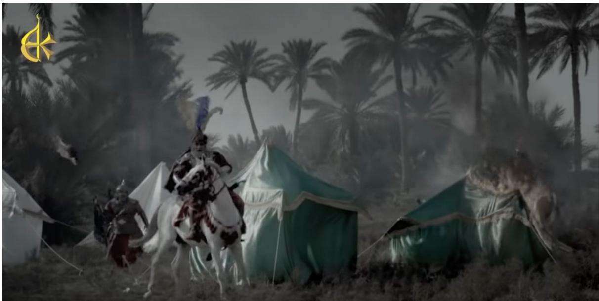
Fig. n°2. L'imam al-Ḥusayn. Capture d'écran du clip de Bāsim al-Karbalā'ī, Barā'at al-ashīq