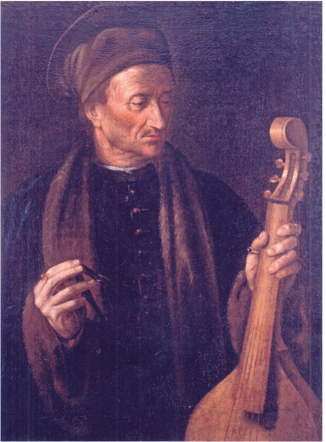
Fig. 1 : Attribué à Pier Francesco di Jacopo Foschi (1502–1567), Portrait présumé d'Alfonso della Viola (c. 1508–c. 1572), huile sur toile, c. 1550, coll. René Prunières.