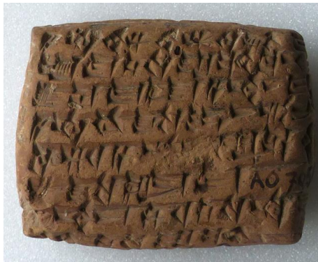
Figure 1 : Lettre de Tarām-Kūbi et Šimat-Aššur à leur frère Imdī-ilum : « le dieu Aššur ne cesse de te mettre en garde : tu aimes beaucoup trop l'argent et tu méprises ta vie ! » Musée du Louvre.

Une partie des étoffes exportées en Anatolie est produite localement par les assyriennes. Ces femmes, restées seules à la tête de leur maisonnée à Aššur, en plus de leurs tâches domestiques, filent et tissent des étoffes de qualité qu'elles envoient à leurs maris et frères à Kaneš afin d'y être vendues. Toutes les femmes de la maison contribuent à cette production domestique, jusqu'à une dizaine, des plus jeunes aux plus âgées. Les bénéfices bruts annuels rapportés par cette activité s'élèvent à 3 ou 4 mines d'argent (1,5 ou 2 kg) par foyer, soit le prix d'une petite maison à Aššur. 5 Les femmes réinvestissent cet argent dans des prêts, des opérations financières et dans le commerce à longue distance.