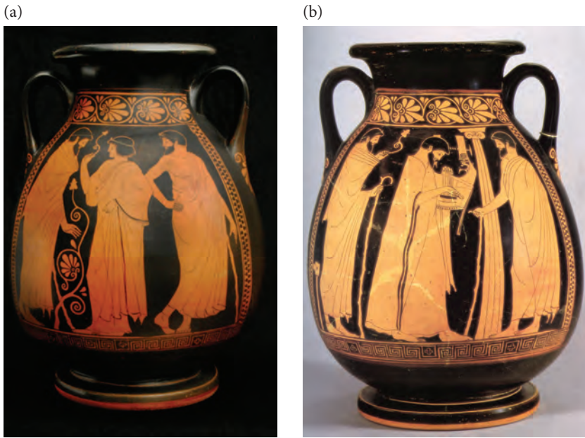
Fig. 3 (a) et (b): Pélikè attribuée au Peintre de Sylée (480–470 av. J.-C.), Collection de Giuseppe Sinopoli.

ainsi que la plante fleurie, dressée dans l'espace très étroit entre les deux personnages, met en valeur, embellit et glorifie non seulement la jeune femme mais aussi son lien avec l'homme qui lui fait face 34 . Fleur et plante créent entre les deux une tension et une complicité affective pourtant absente entre la jeune femme et l'homme à droite dont la posture corporelle dit explicitement qu'il est le perdant dans ce jeu de séduction.