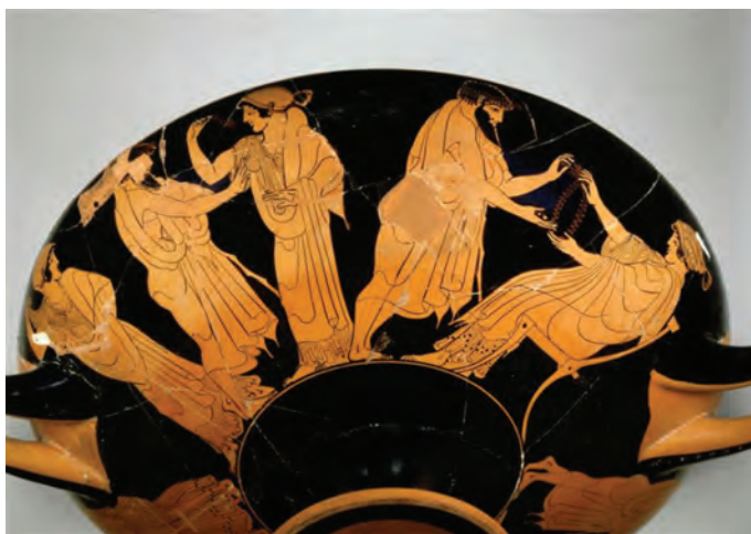
Fig. 2 (a) et (b): Coupe attribuée à Macron (vers 490 av. J.-C.), Paris, Musée du Louvre.

sont-ils des pièces de monnaie, des osselets ou autre chose ? S'il s'agit de pièces de monnaie, le rapport entre les deux personnages a un caractère vénal et donc obligé. Dans ce cas-là, cet homme aurait dans les mains deux objets antithétiques : d'un côté de l'argent, signalant un univers marchand où il n'y a pas d'échanges gratuits mais seulement la contrainte