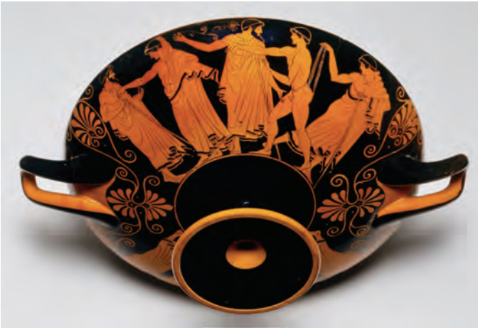
Fig. 4: Coupe attribuée à Douris (vers 490 av. J.-C.), New York, Metropolitan Museum of Art.

cadeaux typiques de la cour pédérastique tels qu'une fleur, un coq et un lièvre 40 .