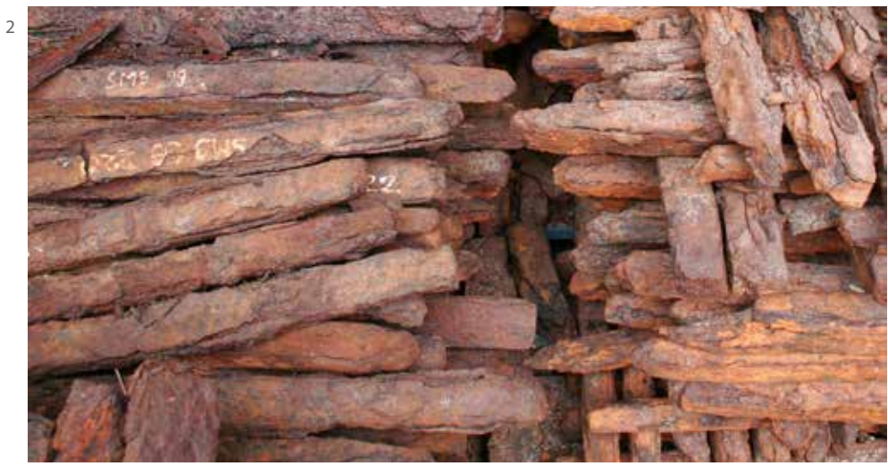
Fig. 2. Barres de fer de type de 2M de l'épave SM9 prélevées au cours des fouilles subaquatiques dirigées par Luc Long.