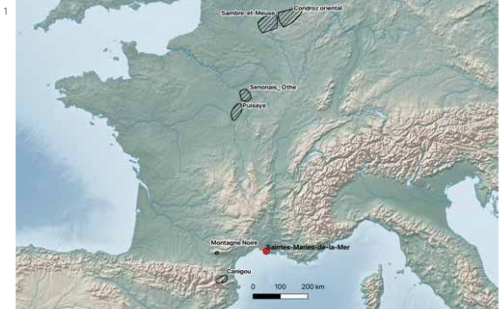
Fig. 1. Les principales zones de production du fer antique en Gaule et la localisation des épaves romaines des Saintes-Marie-de-la-Mer (Bouches-du-Rhône, France) au débouché de l'ancien bras du Rhône Saint-Ferréol (Nord en haut de la carte).