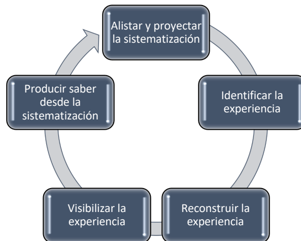
Gráfico 2. Ruta para la sistematización de experiencias educativas.

Los anteriores aspectos, permiten llamar la atención sobre algunas dimensiones importantes cuando se realiza una sistematización de experiencias educativas, de ahí que sea necesario establecer una ruta para ello, la cual está conformada por los siguientes momentos: alistar y proyectar la sistematización, identificar la experiencia, reconstruir la experiencia, visibilizar la experiencia y producir saber desde la sistematización (ver gráfico 2).