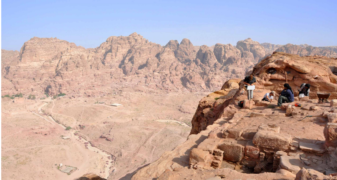
Fig. 3 : Les salles chaudes des bains du Jabal Khubthah en cours de fouille (MAFP 2014)