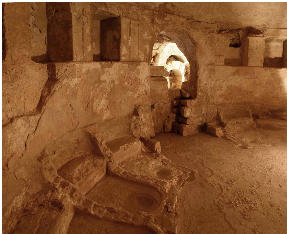
Fig. 7 : Un exemple de bain égyptien au tournant de notre ère : la rotonde des bains de Taposiris Magna, dans la région d'Alexandrie (Th. Fournet).

Parallèlement à ces découvertes, les travaux récents menés en Égypte ont montré avec quel succès le bain collectif, hérités du monde grec, avait envahi le monde ptolémaïque (fig. 7). A tel point qu'à la fin du I er s. av. J.-C. chaque village, d'Alexandrie à Karnak, possédait un ou plusieurs de ces édifices.