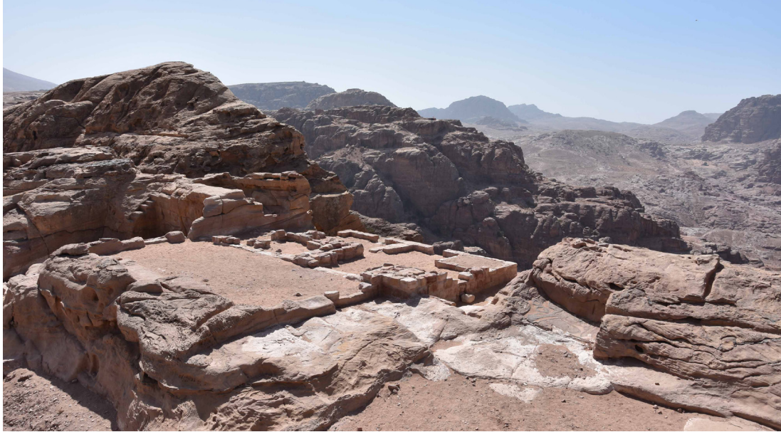
Fig. 5 : Vue d'ensemble des bains du Jabal Khubthah, depuis le nord-est (MAFP 2017)