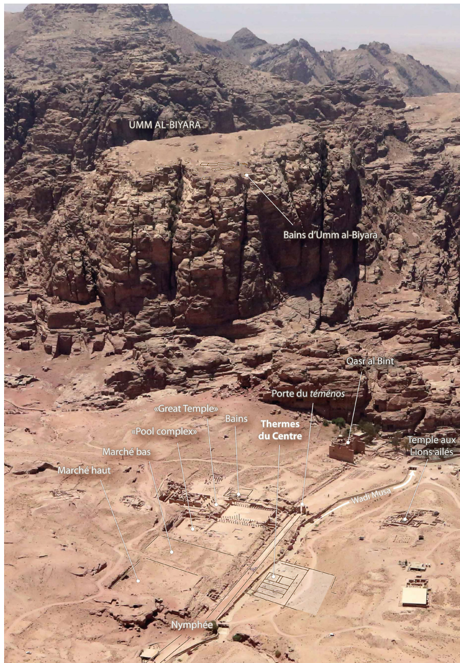
Fig. 1 : Vue aérienne du centre de Pétra, depuis le nord-est. Localisation des thermes du centre et, au second plan, des bains d'Umm al-Biyara

Il y a dix ans encore un seul édifice thermal public était connu à Pétra, les bains du « Great Temple », et l'on ne pouvait, par comparaison avec les autres villes de la région, que s'étonner d'un parc balnéaire si réduit dans une cité par ailleurs si riche. Plusieurs découvertes récentes permettent de combler en partie cette lacune et de saisir enfin les modalités d'adoption des pratiques thermales dans la capitale nabatéenne.