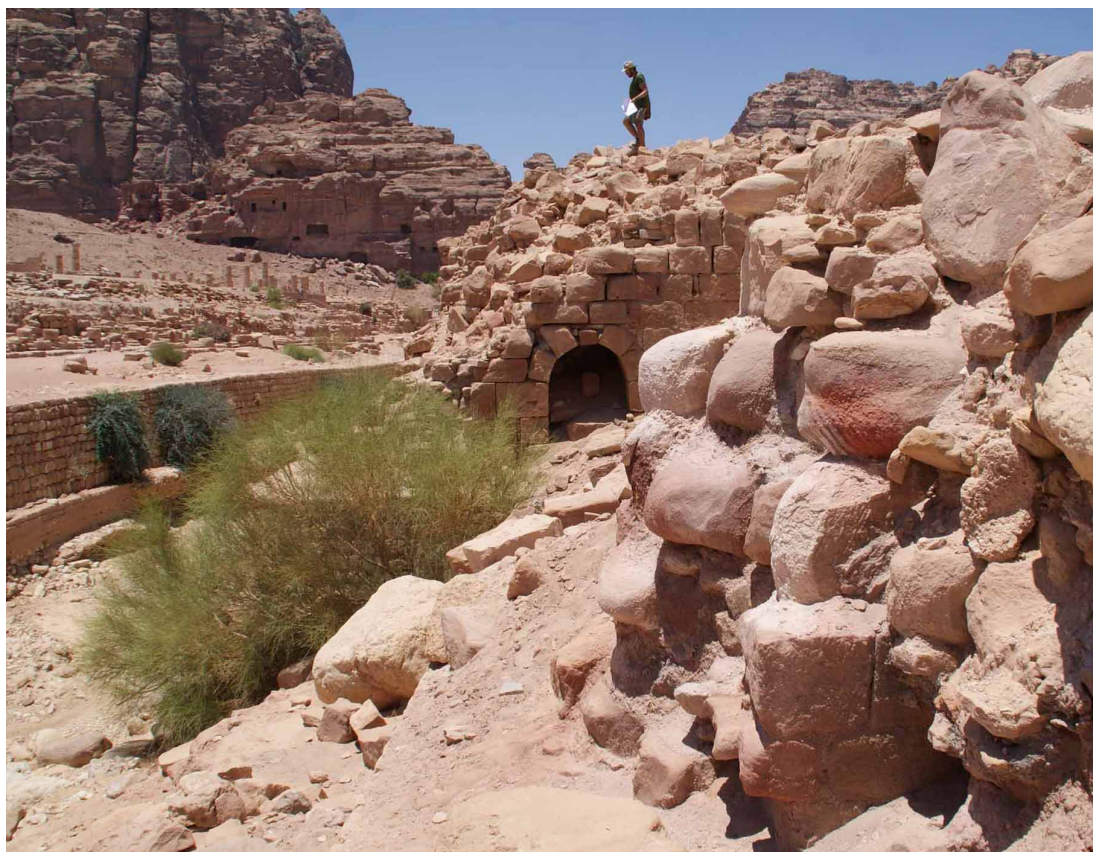
Fig. 2 : Les thermes du centre à Pétra, soubassement et ouverture d'un couloir de service, depuis l'est (Missions archéologique française de Pétra (MAFP) 2012)

La première de ces découvertes, au centre de la ville antique, se fit à l'occasion d'un chantier-école mené par une université jordanienne. Le champ de ruines situé au nord du « pool complex », traversé chaque jour par des milliers de touristes (fig. 1), s'est révélé être un édifice thermal de plus de 2500 m 2 . Très ruiné, n'apparaissent aujourd'hui que les soubassements et quelques sols de marbres (fig. 2). Assez cependant pour y reconnaître un édifice très similaire aux grands thermes impériaux bâtis dans les cités voisines entre les II e et IV e s. de notre ère, à Jérash par exemple. Cette découverte permet de mesurer l'impact de l'annexion romaine de 106 sur l'urbanisme de Pétra, entièrement remodelé par la construction de ces bains, mais aussi de portes monumentales, de fontaines et portiques.