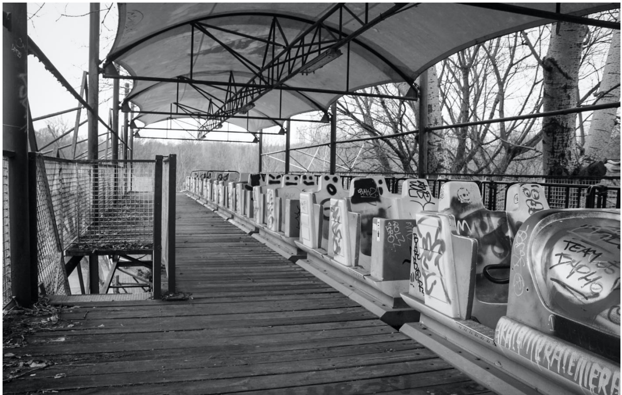
Couverture : Un manège abandonné du parc d'attraction désaffecté Spreepark à Berlin

Pour citer cet article : Le Gallou A. et Lesné R., 2022, « Urbex 404 – Interroger la valeur des espaces abandonnés par l'exploration urbaine », Urbanités #17 / L'erreur est urbaine, janvier 2023, en ligne .