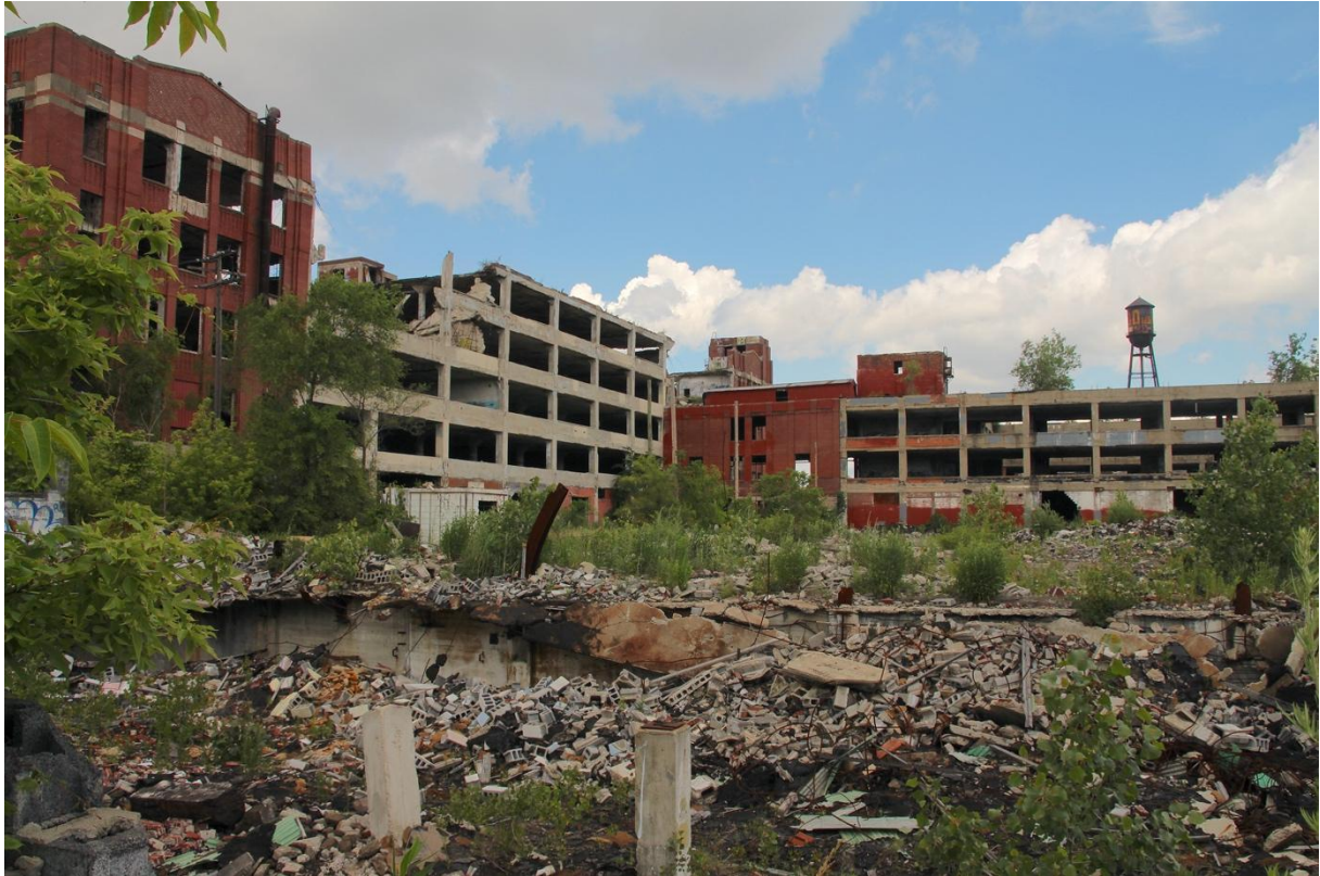
1. La Packard Plant, ancien fleuron de l'industrie automobile de Détroit, désormais ruine emblématique de la ville (Le Gallou, 2017)