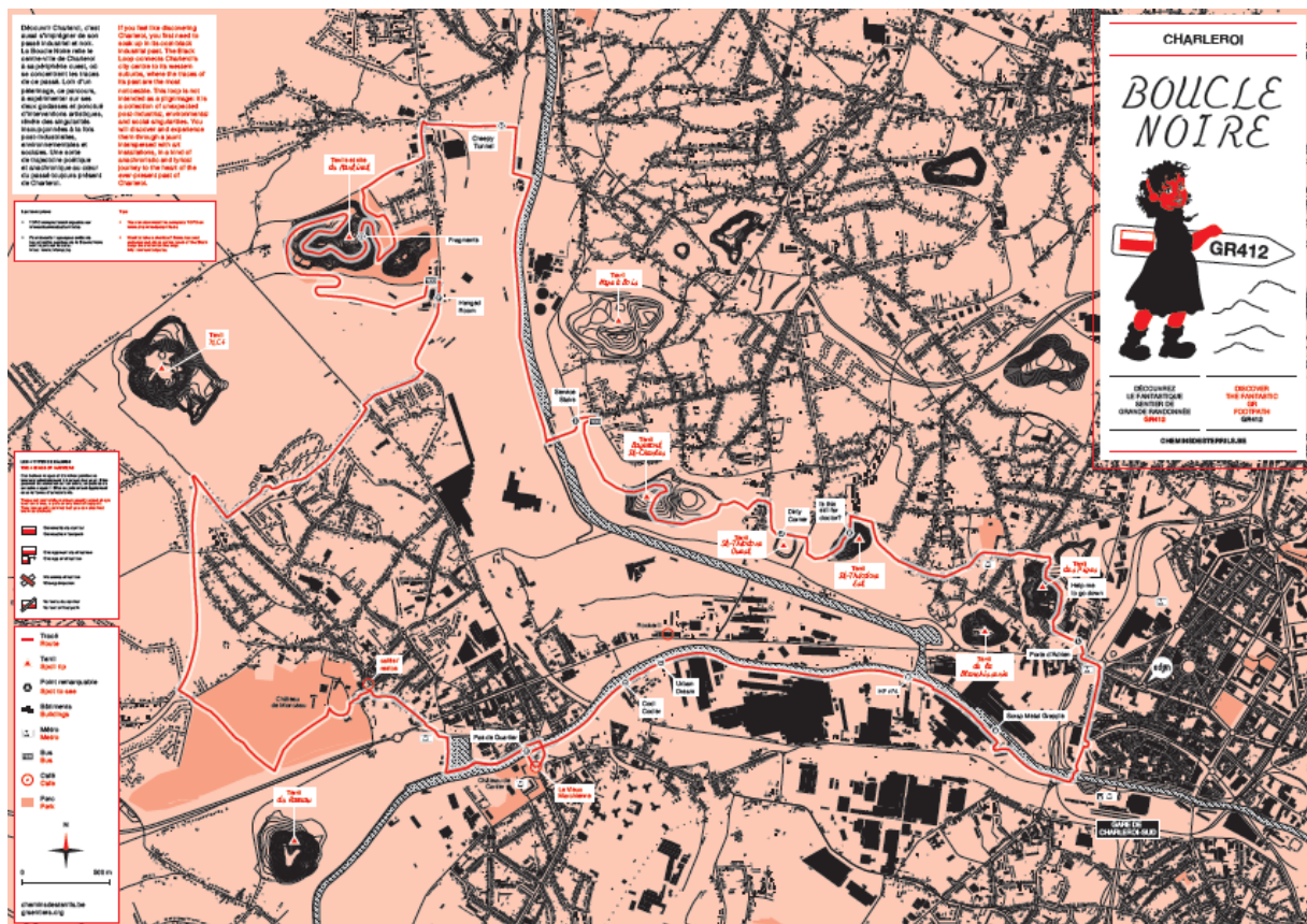
4. Carte de la Boucle noire de Charleroi

Par extension, l'erreur urbaine peut également avoir un rôle dans la fabrique urbaine, à savoir être source de jeu dans son mécanisme (Lottigier-Brossard, 2015 ; Riffaud, 2021) – au sens de l'espace entre deux pièces assemblées imparfaitement – et constituer un interstice pour des formes de créativité spontanée. L'enjeu de la « saisie » des erreurs urbaines se situe donc également au niveau de leur acceptation et intégration dans la fabrique de la ville par les pouvoirs publics. Dans le secteur du marketing territorial, la tendance est actuellement à la mobilisation de ces friches (Ambrosino et Andres, 2008 ; Gravari-Barbas, 2009), à travers leur appropriation par des activités culturelles structurées et normalisées, comme des outils de promotion de l'image d'un territoire et de son attractivité. En témoigne l'usage des espaces abandonnés en sites de loisir et de tourisme à Roubaix, notamment autour du graffiti ou du parkour (Lesné, 2021b), ou à Charleroi où un couple de passionné·e·s a mis en place un chemin de randonnée, la Boucle noire (voir fig. 4), à travers ses zones industrielles répulsives (voir fig. 5).