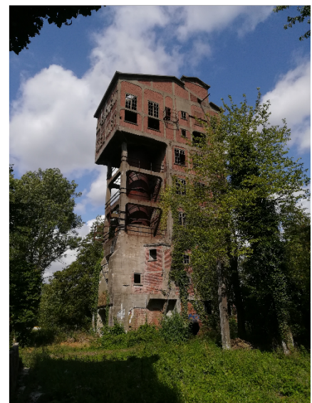
3. Une cimenterie abandonnée, attraction d'un village du Hainaut (Belgique) sur laquelle capitaliser ? (Lesné, 2019)