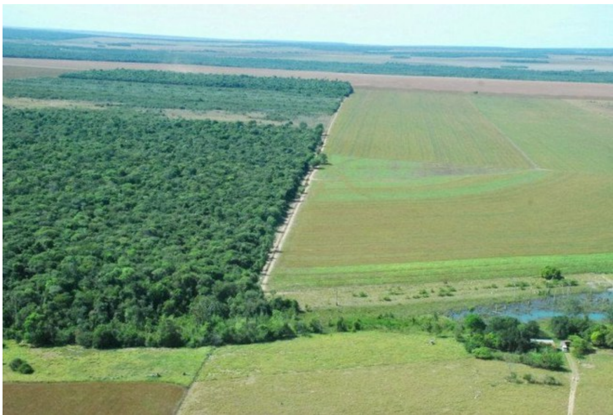
Exemple de Réserve Légale