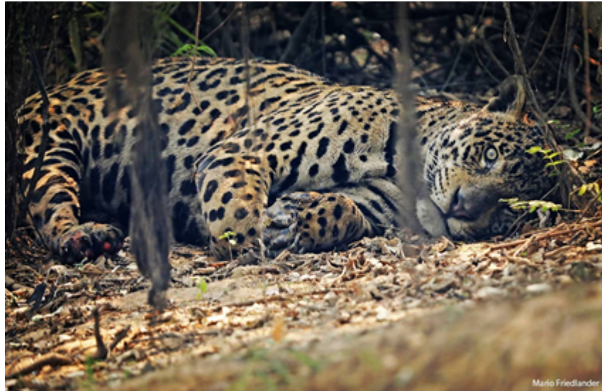
Jaguar prostré, avec les pattes brûlées". Photo du photographe et documentariste Mario Friedlander, Parque Estadual Encontro das Águas (Poconé, Mato Grosso), août 2020. L'auteur a autorisé la reproduction de l'image pour cet article.

Cette année, à Cuiabá, le SUS a déjà noté une augmentation de 30 % < https://olivre.com.br/atendimento-por-complicacao-respiratoria-cresce-30-em-cuiaba > des arrivées à l'hôpital pour problèmes respiratoires, une augmentation pourtant en deçà de ce qui était attendu (même si la situation peut varier d'un hôpital à l'autre), que l'on peut expliquer de deux manières : une partie des personnes concernées éviteraient en effet de se rendre à l'hôpital par peur d'attraper la Covid, et une autre partie ne s'y rend pas car une partie des équipements respiratoires d'habitude utilisés pour les patients souffrant des fortes chaleurs, le sont pour la Covid.