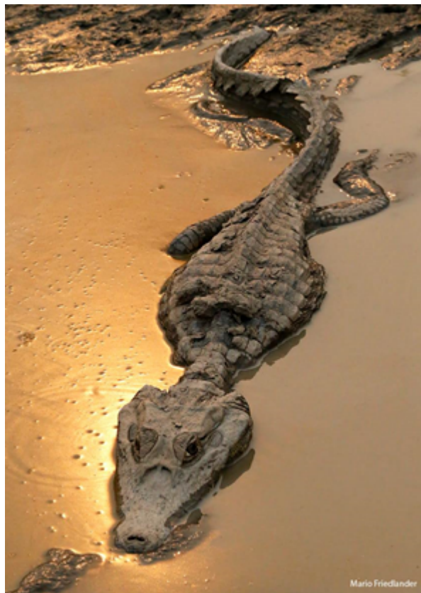
Photo du photographe et documentariste Mario Friedlander, prise sur la Transpantaneira (Pantanal, Mato Grosso), août 2020. L'auteur a autorisé la reproduction de l'image pour cet article.

S'il n'est pas rare que la ville connaisse ce type d'épisode (elle n'est d'ailleurs pas la seule à avoir subi ces désagréments puisque les fumées sont arrivées jusque dans l'État du Paraná < https://g1.globo.com/pr/noroeste/noticia/2020/09/02/fumaca-das-queimadas-do-pantanal-chega-ao-noroeste-do-parana.ghtml > ainsi que dans l'État du Rio Grande do Sul < https://g1.globo.com/rs/rio-grande-do-sul/noticia/2020/09/11/fumaca-das-queimadas-no-pantanal-chega-ao-rs.ghtml > , et ont également atteint les villes < https://oglobo.globo.com/sociedade/especialistas-alertam-para-efeitos-da-fumaca-do-pantanal-no-rio-sp-24639899 > de Rio de Janeiro et São Paulo), la durée et l'intensité de l'épisode actuel sont particulièrement inhabituels, et son occurrence dans un contexte particulièrement tendu sur le plan sanitaire en fait un facteur aggravant.