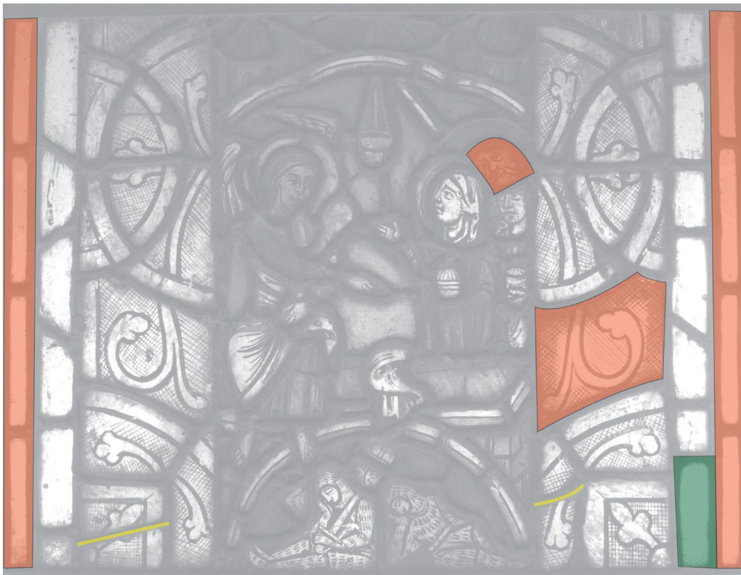
Fig. 5b : Les Saintes femmes au tombeau, critique d'authenticité