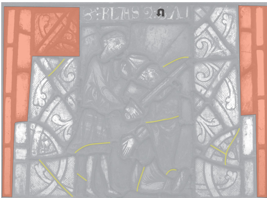
Fig. 8a : Décollation de saint Blaise, critique d'authenticité