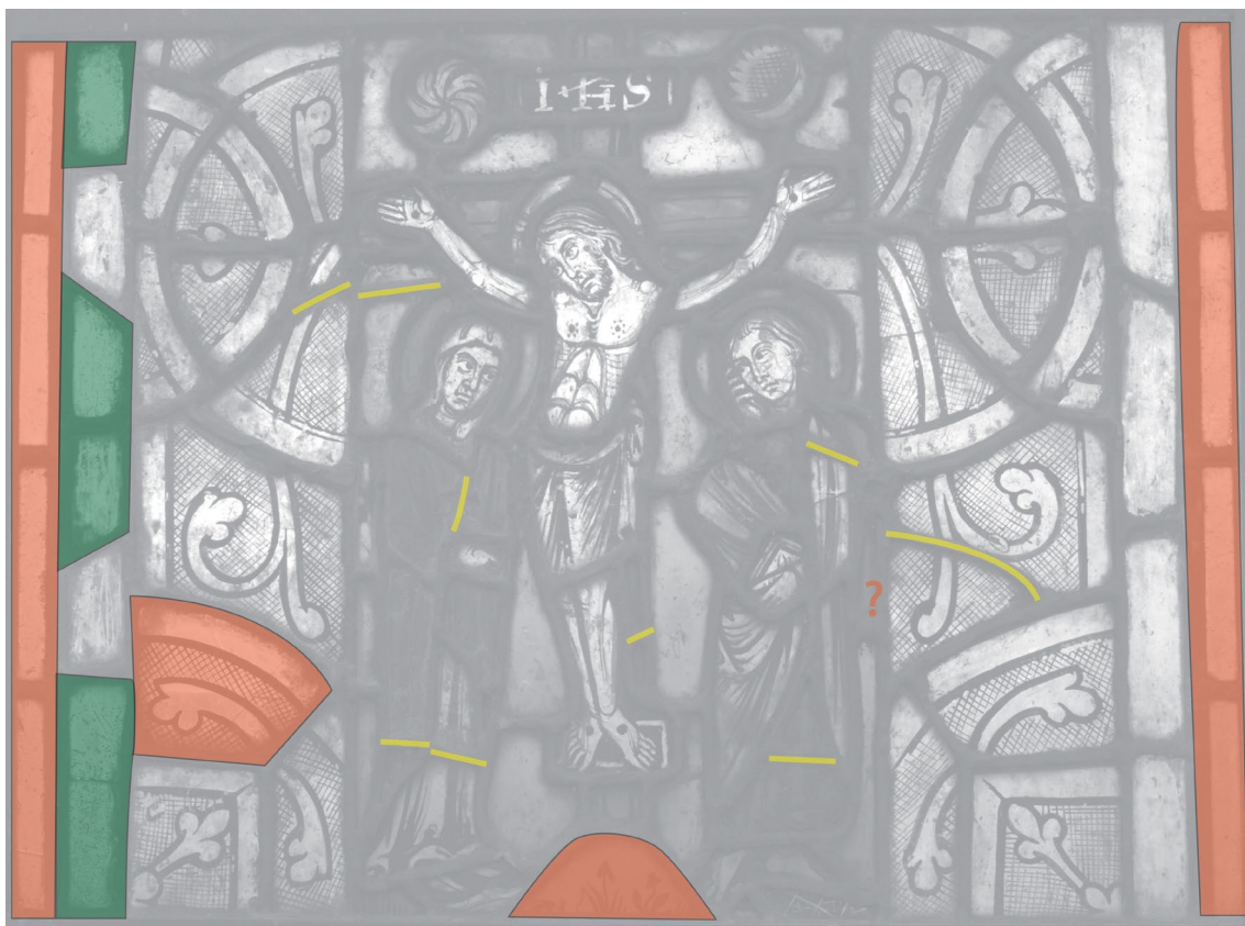
Fig. 3b : La Crucifixion, critique d'authenticité