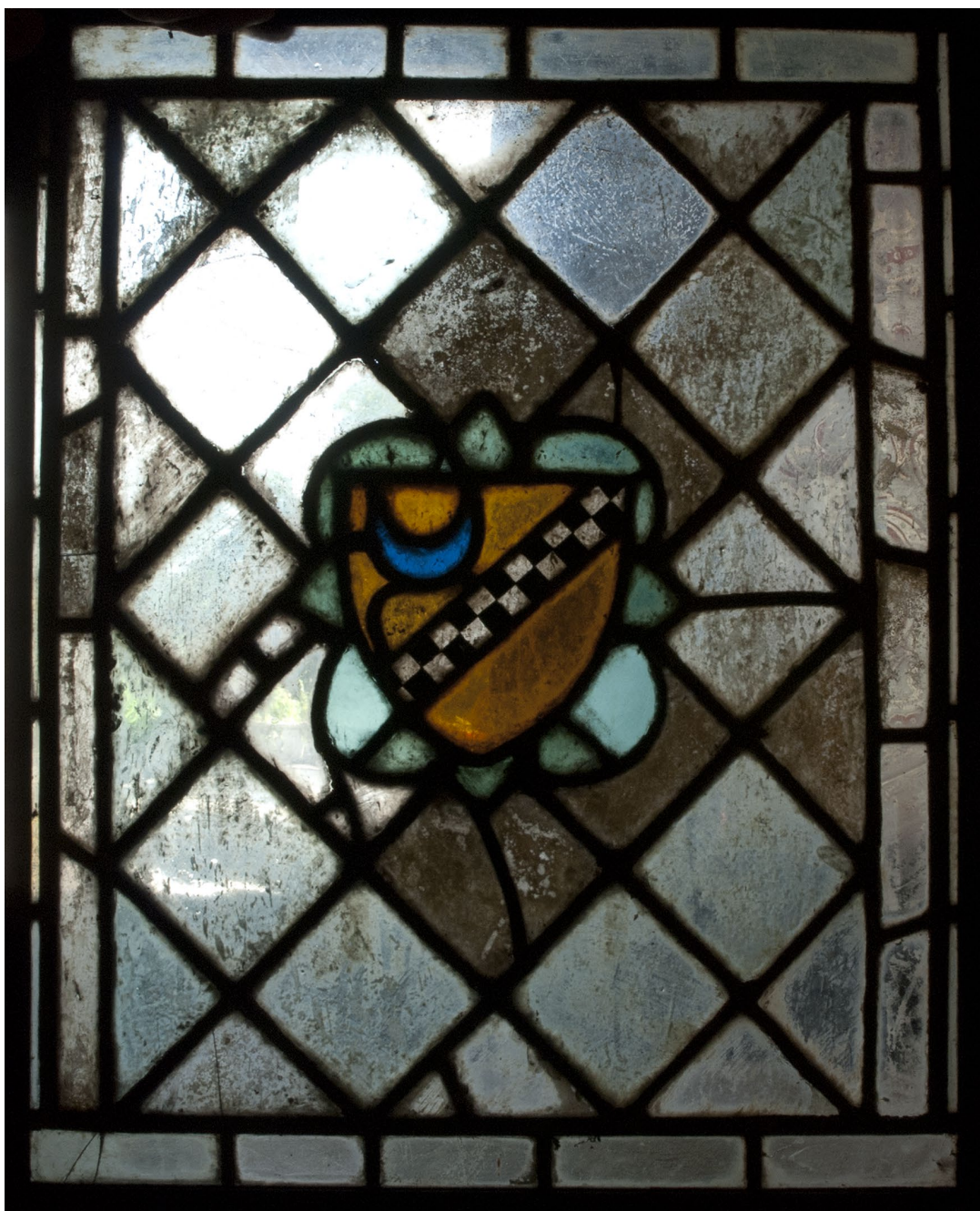
Fig. 7a : Armoiries, collection privée, 4 e quart du XIV e siècle (cl. K. Boulanger). Vue inversée (le montage des armoiries est erroné lorsque le panneau est correctement posé)