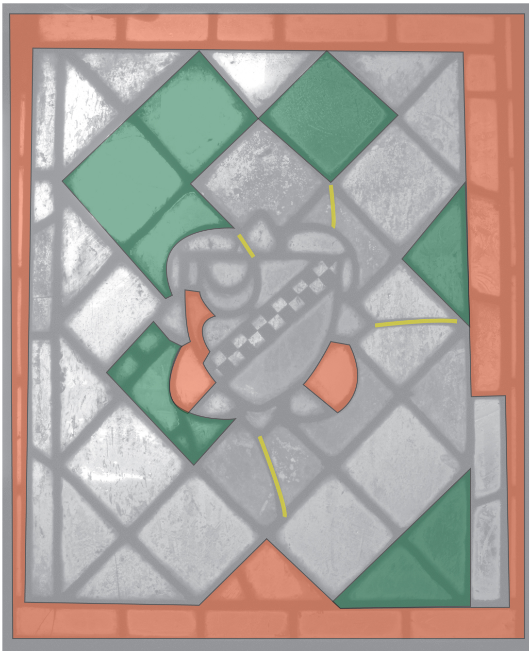
Fig. 7a : Armoiries, critique d'authenticité. Vue inversée (le montage des armoiries est erroné lorsque le panneau est correctement posé)