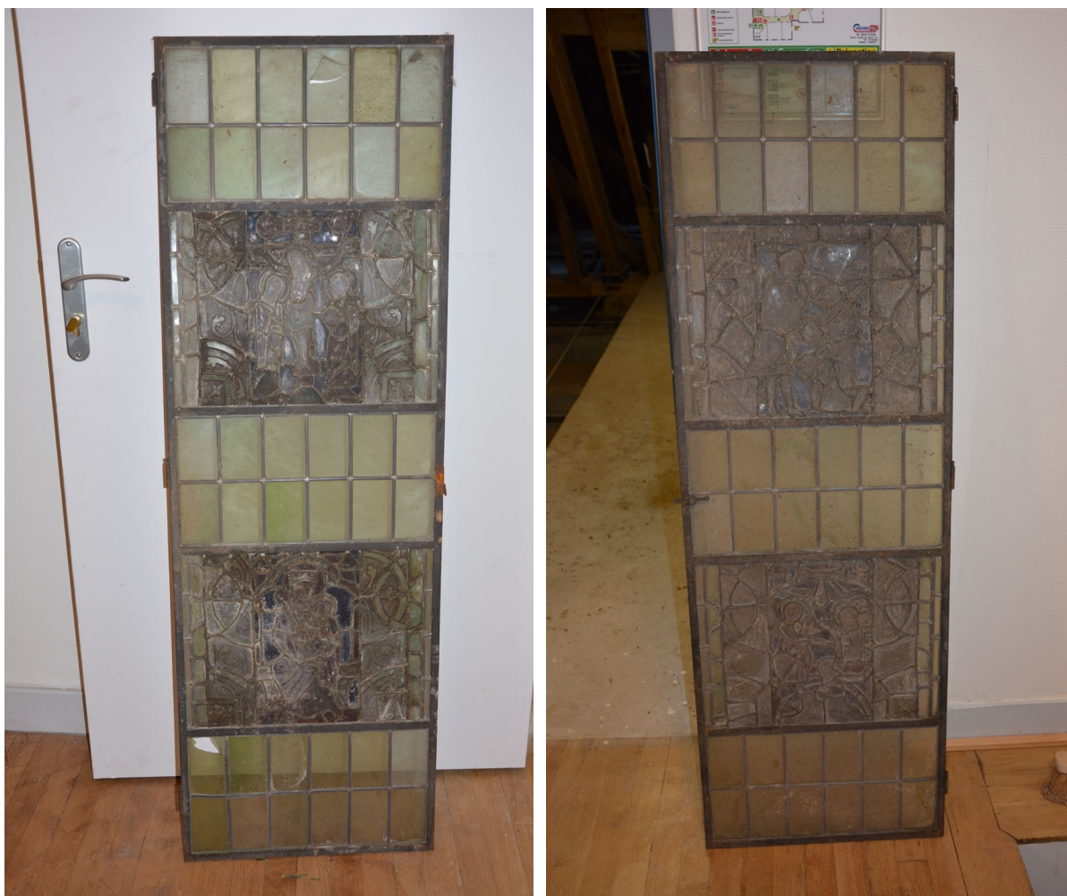
Fig. 1 : les panneaux retrouvés à l'hôtel du département, insérés dans des fenêtres démontées