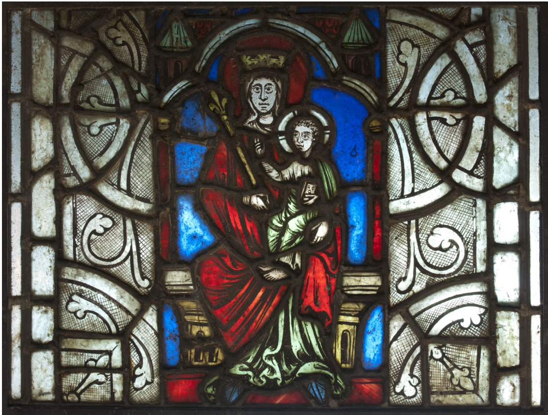
Fig. 4a : La Vierge à l'Enfant, panneau conservé à l'hôtel du département de Guéret, 1 er tiers du XIII e siècle