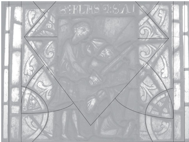
Fig. 10 : Schéma du réseau géométrique de la grisaille de l'une des baies latérales. On ignore le dessin du centre du motif