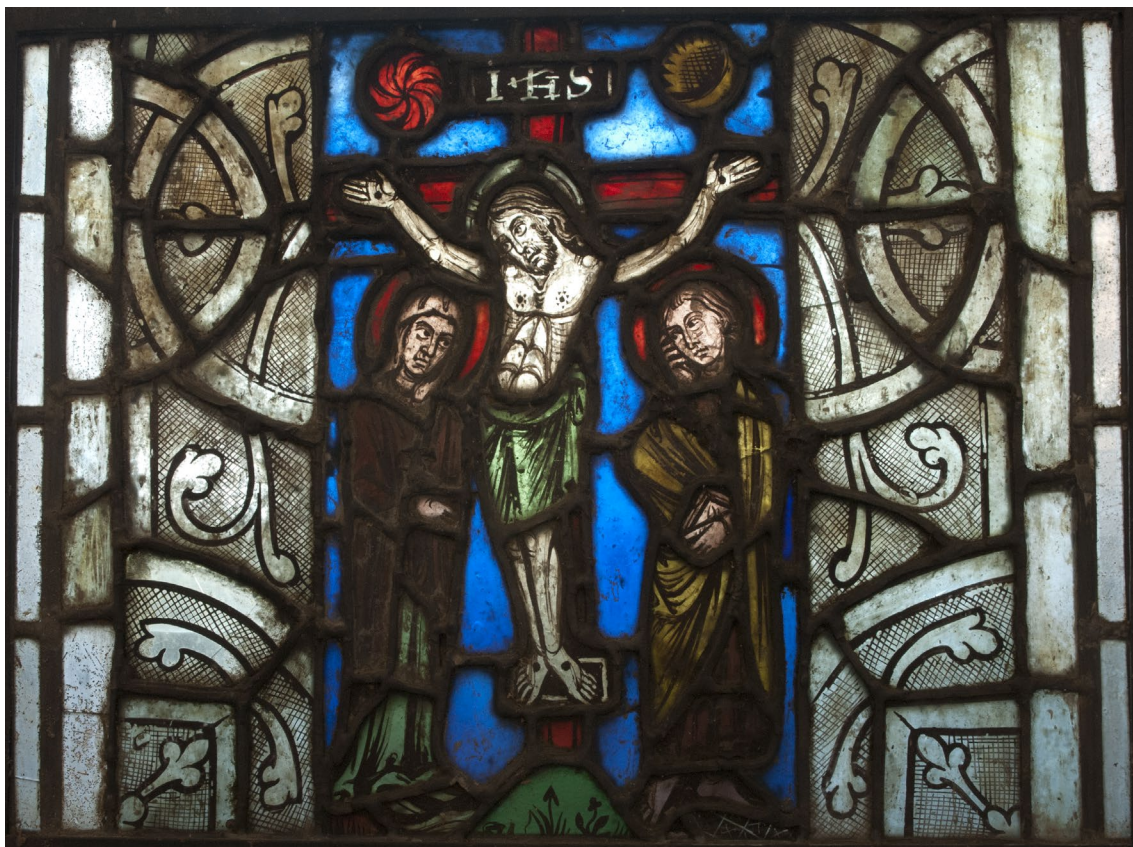
Fig. 3a : La Crucifixion, panneau conservé à l'hôtel du département de Guéret, 1 er tiers du XIII e siècle