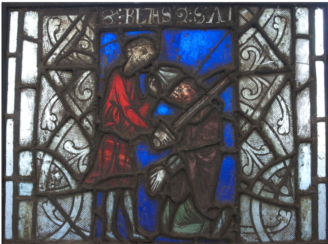
Fig. 8a : Décollation de saint Blaise, hôtel du département de Guéret, 1 er tiers du XIII e siècle.