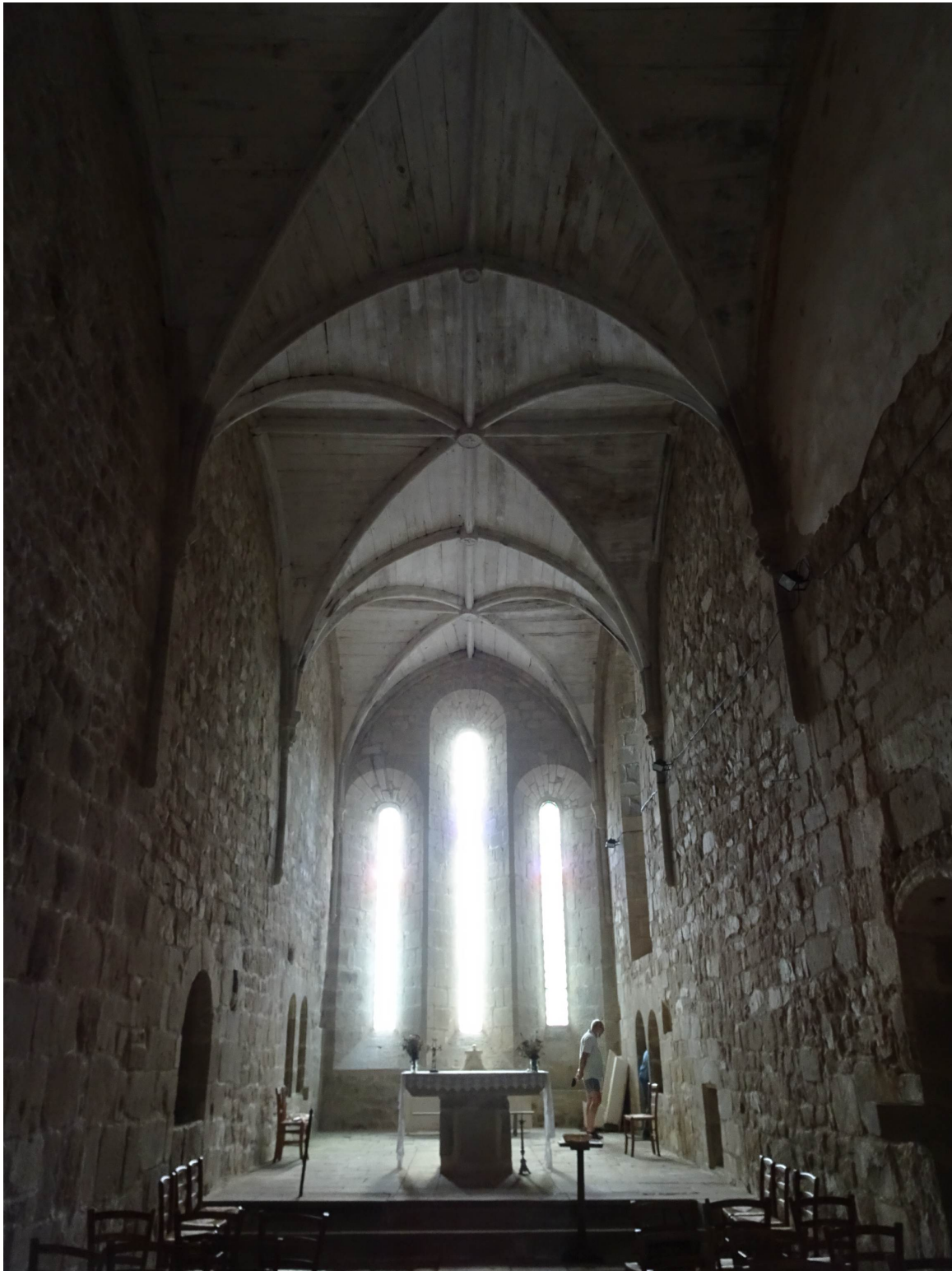
Fig. 2 : L'église de Chamberaud, vue du chœur.