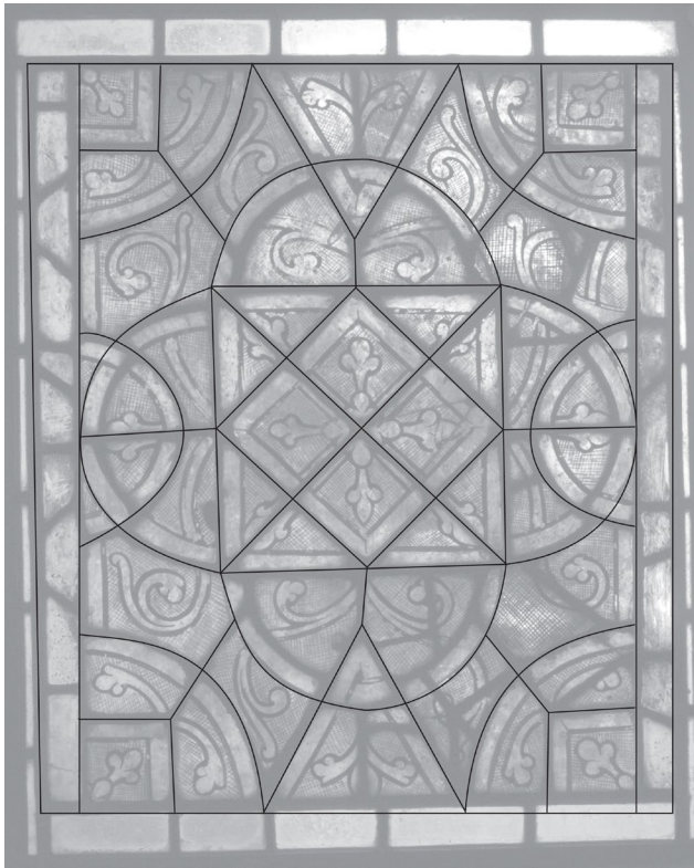
Fig. 9 : Schéma du réseau géométrique de la grisaille de la baie 0