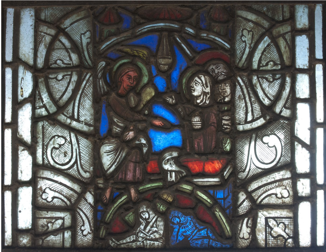
Fig. 5a : Les Saintes femmes au tombeau, panneau conservé à l'hôtel du département de Guéret, 1 er tiers du XIII e siècle