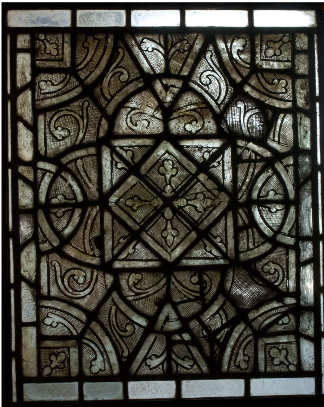
Fig. 6a : Grisaille, collection privée, 1 er tiers du XIII e siècle