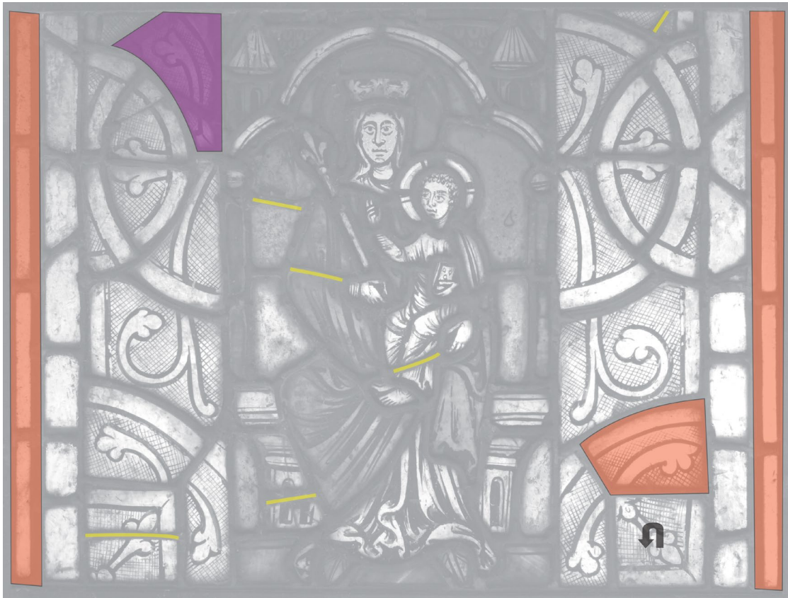
Fig. 4b : La Vierge à l'Enfant, critique d'authenticité