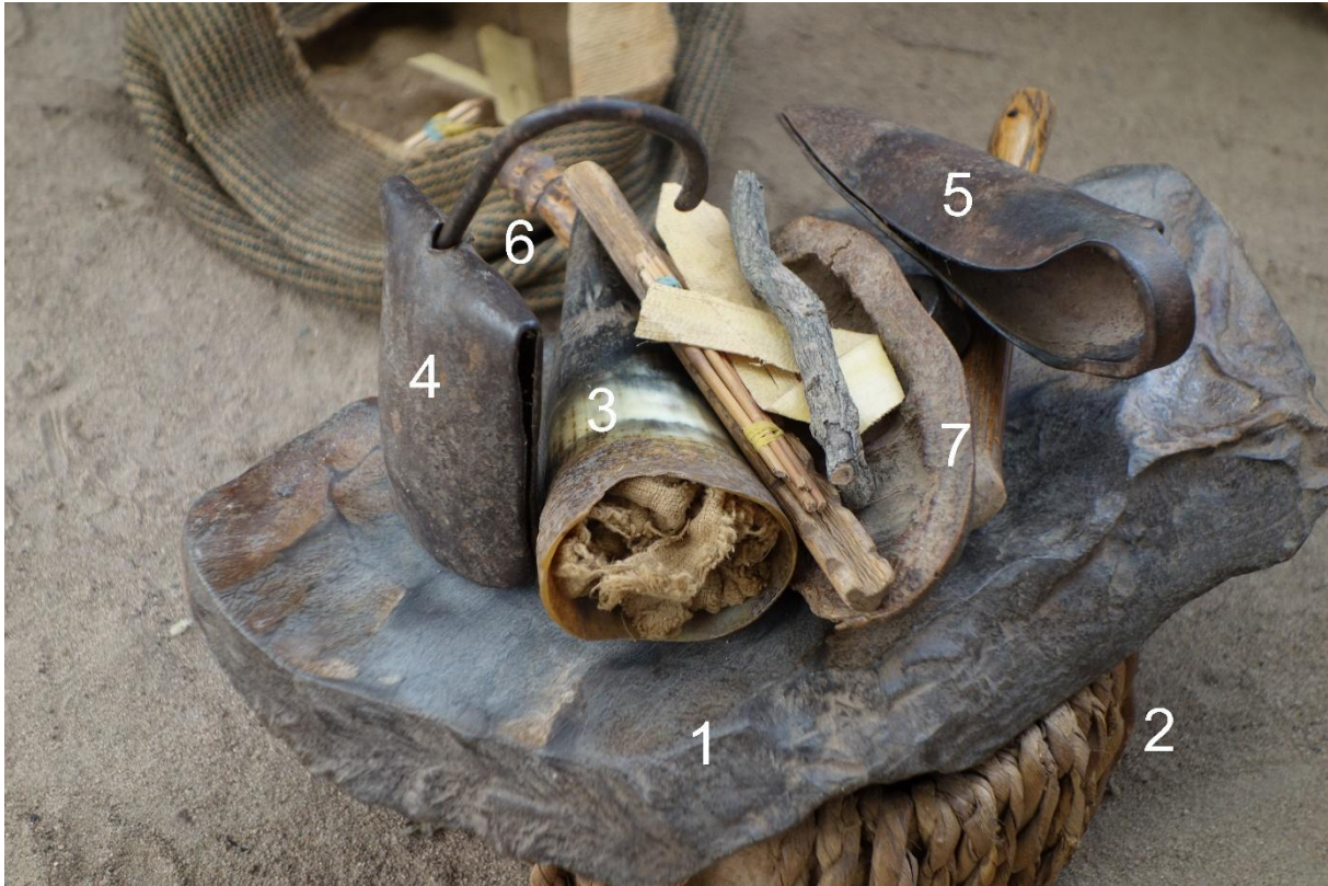
Figure 2. Le matériel du devin

énonce successivement plusieurs propositions alternatives, par exemple « le problème est dans la cour/ le problème n'est pas dans la cour », jusqu'à ce que l'une d'entre elles soit « acceptée » par l'oracle. Pour confirmer ou infirmer la réponse reçue, il exécute une série de jets de cauris sur la pierre. Ensuite, il reprend le bâton pour présenter de nouvelles propositions alternatives et jette à nouveau les cauris. C'est ainsi qu'il progresse peu à peu dans la compréhension du problème au sujet duquel la divination est faite.