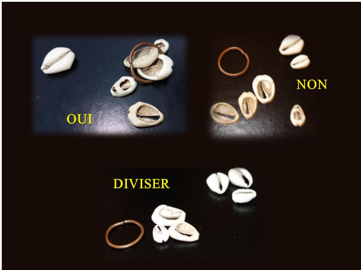
Figure 4. Exemple de réponses positives ou négatives des cauris aux questions du devin.

En haut : à gauche, la réponse « oui » est donnée par un unique cauri du lot se présentant « ouvert » ; toute autre position, comme à droite, signifie « non ». En bas : réponse positive à la demande « divisez », une moitié des cauris sur une face, l'autre sur l'autre face, les deux lots étant de plus séparés.