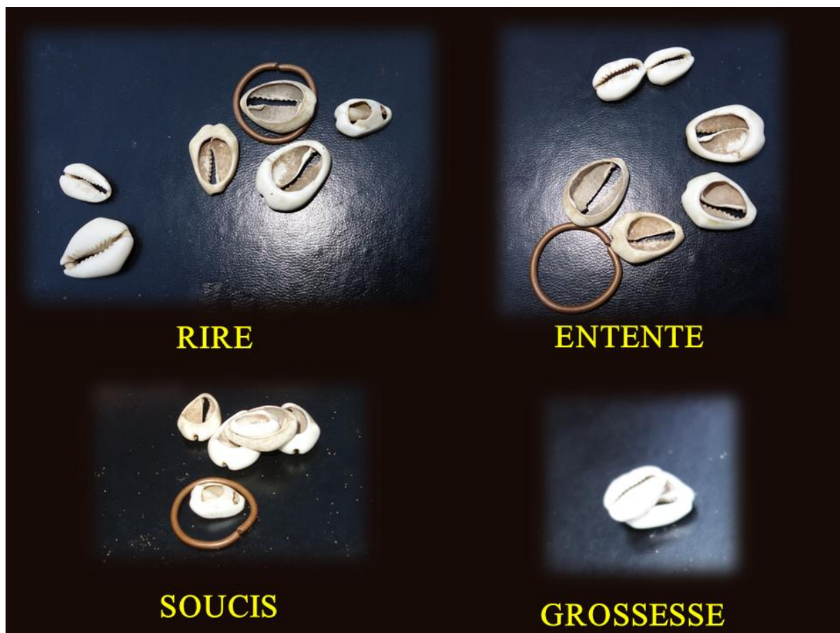
Figure 5. Figures par lesquelles la puissance divinatoire donne des indications au devin

Quelques exemples de dispositions significatives des cauris.