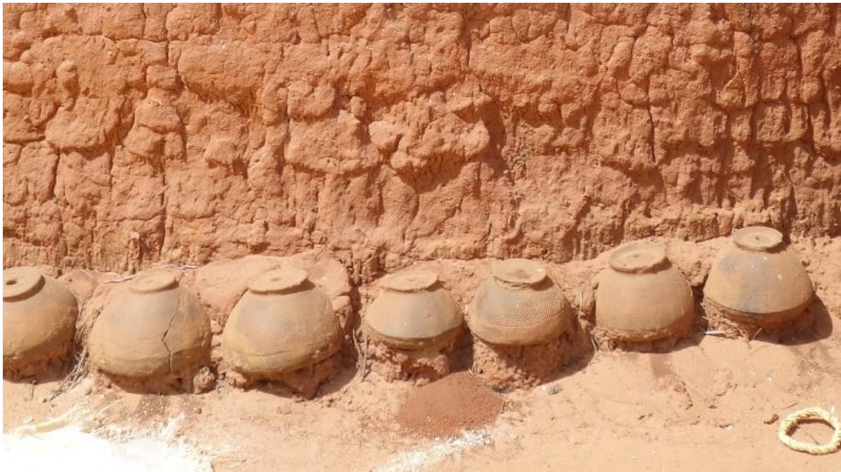
Figure 3 « Fétiches » de la Chance

« fétiches » qui te gardent 30 . Si quelque chose t'atteint, c'est que tes Choses Gardiennes t'ont lâché, sinon elles te protègent contre toutes les mauvaises choses. Si tu as des ennuis, des rêves bizarres, des maladies, des accidents..., c'est forcément parce qu'une ou plusieurs de tes Choses Gardiennes ( myen mê ) sont en colère » 31 .