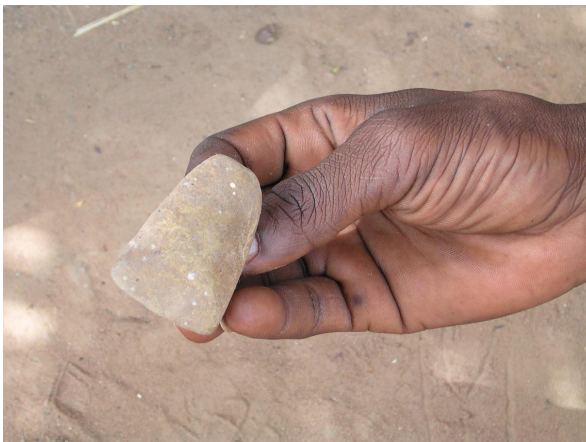
Figure 9. Objet servant à « poser » Kutyon dans la maisonnette du génie

l'importance que les Sèmè accordent à ces questions (voir l'annexe). Pour notre propos, ce qui importe c'est que par le jeu des incarnations successives de son nuon , toute personne est reliée à une longue chaîne d'ancêtres. Au cours de nombreuses existences, son nuon a été lié à différents groupes de Choses Gardiennes. Dans cette chaîne, les personnes les plus anciennes ne peuvent plus être identifiées par un nom et sont évoquées par le terme collectif de Kutyon . Kutyon est donc en quelque sorte la somme de tous ces ancêtres et dispose d'une perspective cavalière sur l'enchaînement des générations d'humains depuis le début des temps. À la différence des autres puissances, Kutyon n'est pas pensé comme attaché à une personne, il est la totalité des mémoires concernant tous les Sèmè. C'est pourquoi Kutyon est la clairvoyance même et c'est aussi pourquoi certains Sèmè se laissent emporter par l'emphase jusqu'à l'assimiler au dieu créateur. Les devins se dressent contre une telle affirmation et argumentent. Kutyon est certes en un sens plus savant que le dieu créateur qui, orchestrant l'ensemble de la création ( animaux, génies, eau, terre...), ne peut se perdre dans les détails. Kutyon ne connaît en revanche rien de l'avenir, savoir réservé au créateur. Pour bien faire comprendre ce qu'est