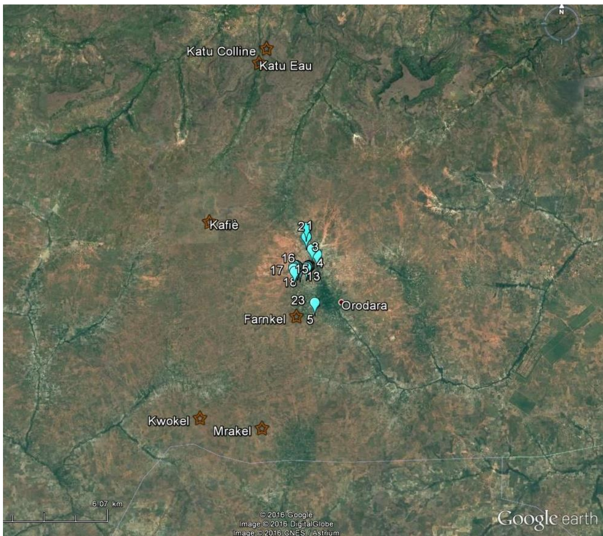
Figure 2. Carte des Eaux et Collines sacrées d'Orodara

que l'autre abrite une maisonnette qui contient des objets sacrés du culte. Dans l'invisible, les génies sont censés se soumettre à une initiation très semblable à celle des humains. Dans le matériel du devin, plusieurs objets évoquent le culte du Dwo (premier article).