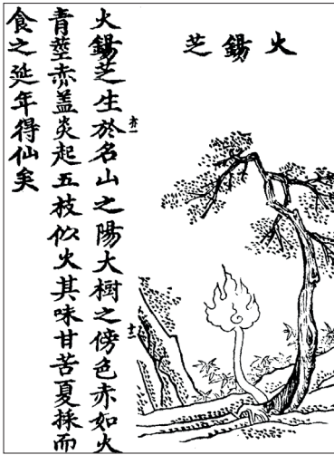
Figure 1 Zhi Fiamma Ardente (huoyangzhi, DZ 1406, p. 15a)