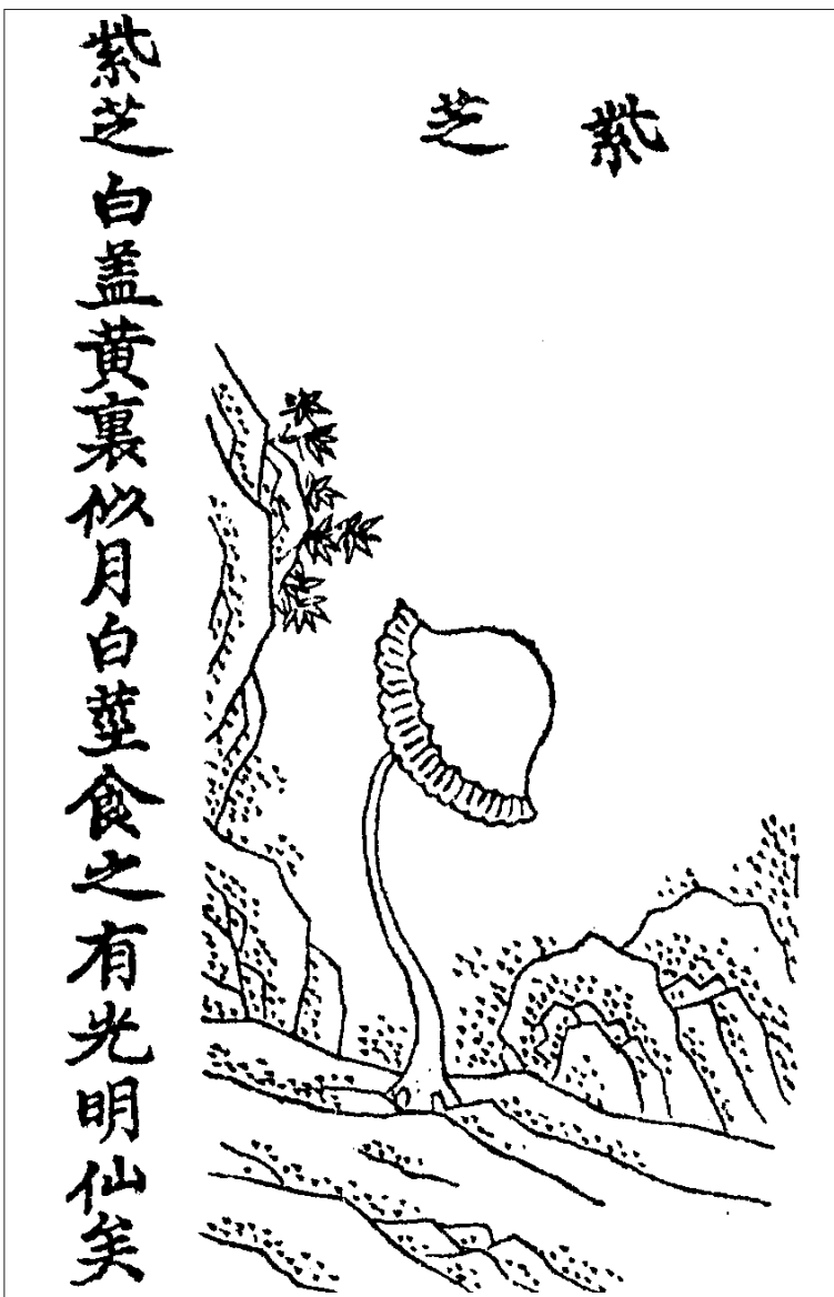
Figure 10 Zhi purpureo (Zizhi, DZ 1406, p. 44a)