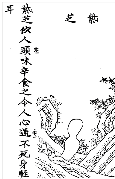
Figure 3 Zhi Chi Songzi (chi songzi zhi, DZ 1406, p. 15b)