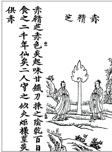
Figure 2 Zhi Essenza del Rosso (chijingzhi, DZ 1406, p. 42b)

la Regina Madre d'Occidente, divinità e regina del Paradiso Occidentale, salire e scendere con il vento, andare e venire da est a ovest, e infine divenire eterno come Cielo e Terra [fig. 3]. 3