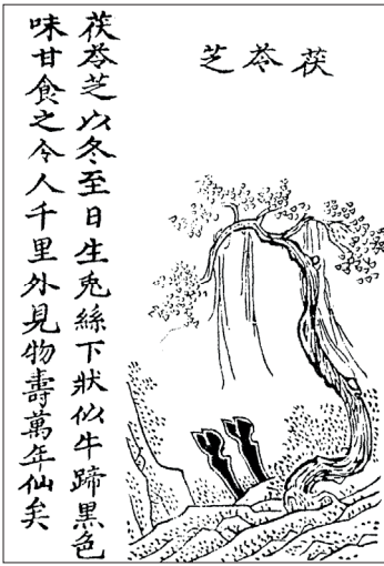
Figure 7 Pachyma cocos ( fuling , DZ 1406, p. 21b)