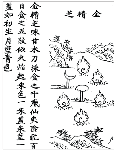
Figure 8 Zhi Essenza del Metallo ( Jinjingzhi , DZ 1406, p. 62a)