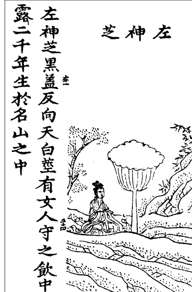
Figure 9 Zhi dello Spirito di sinistra ( Zuoshenzhi , DZ 1406, p. 30a)