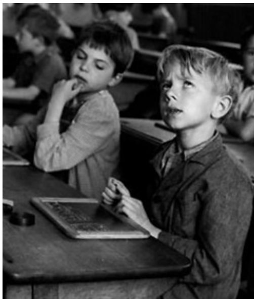
Être présent à soi - Extrait d'un cliché de R. Doisneau 1956

16 mars 2023 par jean-marie.barbier , Martine Dutoit Outils d'analyse 179 visites