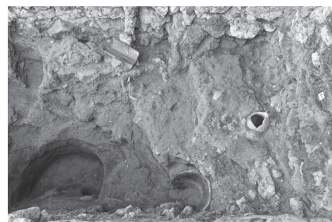
3. Pompei, VI 16, 3-4. Resti, nella stanza 2, di una latrina composta da una colonna di alimentazione, una fogna e una fossa settica. Vista zenitale da nord.

menta di basalto inglobati in frammenti di calcare del Sarno, l'anfora era tenuta in piedi da un riempimento databile al II secolo a.C. La presenza di lische di pesce nella parte inferiore del suo riempimento suggerisce che quest'anfora veniva utilizzata per drenare l'acqua di una cucina, dando una funzione di pozzetto all'insieme. È possibile che l'ambiente in cui si trovava questa fossa fosse già limitato a est da un muro, di cui è stata portata alla luce solo la fondazione in caementa di basalto.