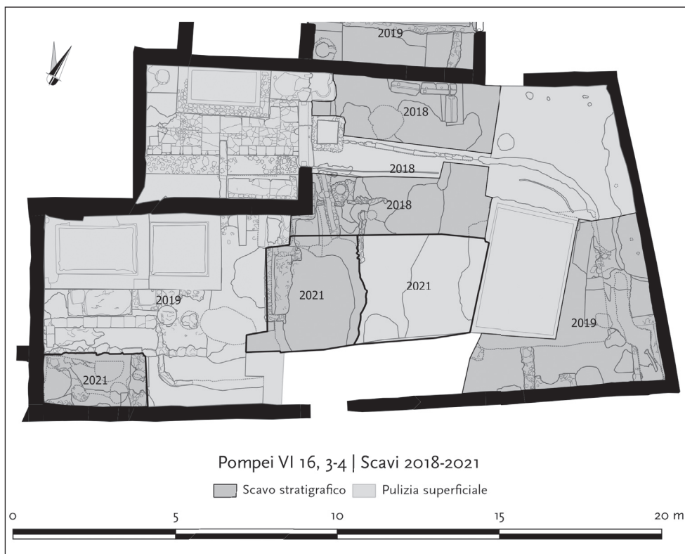
1. Pompei, VI 16, 3-4. Nomenclatura degli spazi e dei limiti delle operazioni di pulizia e scavo durante la campagna 2021. Rilievo, disegno: N. Monteix, F. Fouriaux / EFR.

La prima sistemazione osservata nell'ambiente 2 è un dispositivo frequentemente riconosciuto a Pompei, anche se raramente documentato in dettaglio: un'anfora "di drenaggio", ricavata da un'anfora greco-italica inserita a testa in giù dopo averne tagliato il collo e il fondo e averne perforato il corpo (fig. 2). Installata su un cumulo di caementa