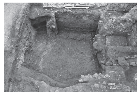
4. Pompei, VI 16, 3-4. Probabile pozzo di estrazione delle argille dell'eruzione del Mercato al termine della campagna di scavo. Vista da est.

L'osservazione attenta di una foto scattata poco dopo lo scavo della fullonica nel 1906, grazie alla qualità della digitalizzazione del fondo fotografico del Parco Archeologico di Pom-