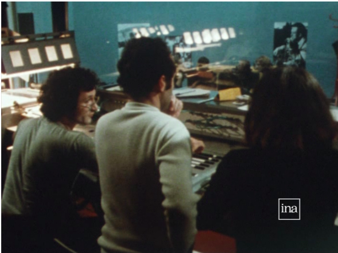
Fig. 3 - La première vie de Vidéogazette : le studio magnétique

Les premières émissions furent diffusées pendant l'année 1973. Vidéogazette émettait alors plusieurs jours par semaine ainsi que le dimanche toute la journée. Le débat était très présent dans la programmation, notamment en présence des élus grenoblois, dans l'émission Agora (« studio ouvert ») programmée le samedi soir, à 18h30. La chaîne avait aussi organisé un système original de feedback du public en collectant des réactions des spectateurs dans les coursives. En juin 1974, une association des usagers fut créée pour essayer d'élargir le public participant activement au Vidéogazette. Pourtant, à partir de 1975 des difficultés liées au coût élevé de production des programmes, à l'impossibilité de toucher un public plus large que celui des immeubles de la Villeneuve ou encore au manque de mobilisation des habitants au-delà du premier cercle des militants commencèrent à se faire sentir. Du fait de changements politiques, l'État se retira du projet, suivi bientôt par la municipalité de Grenoble. Les dernières émissions Agora furent diffusées en avril 1976.