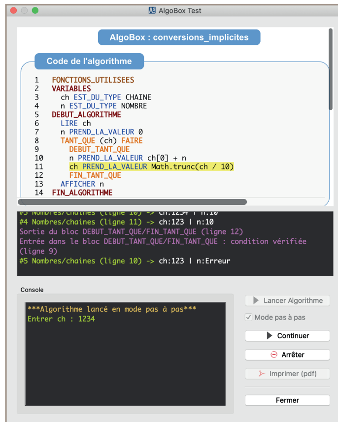
Figure 2 – Fenêtre d'exécution