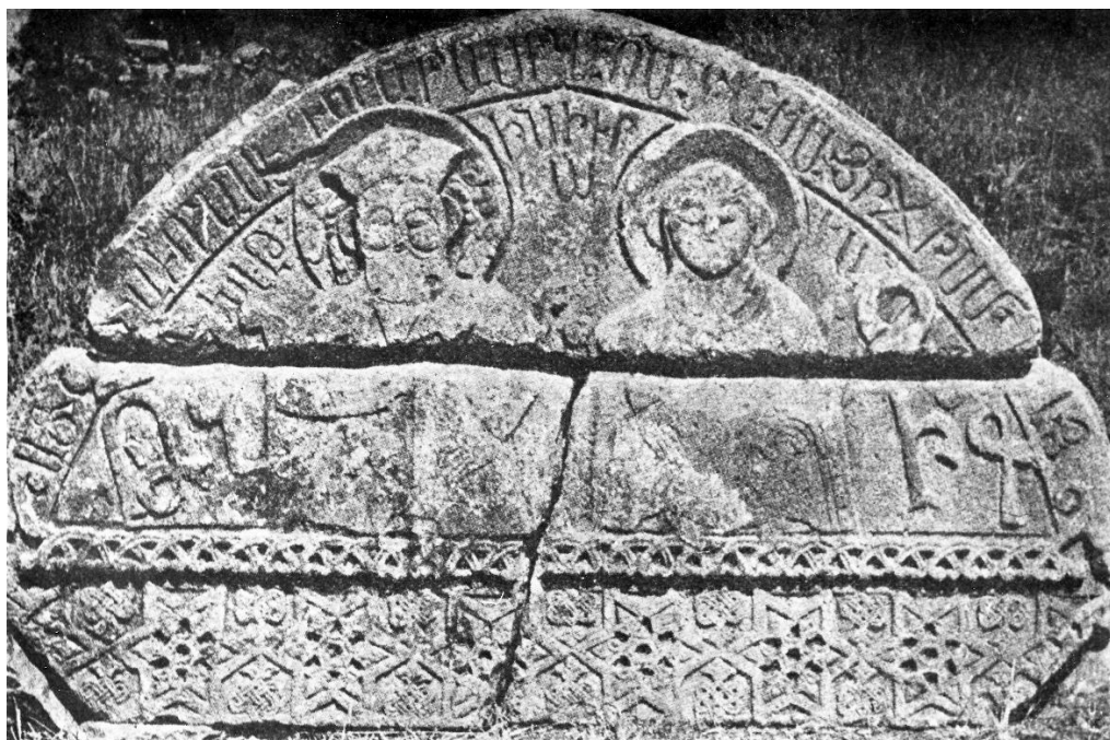
Fig. 2. Éghéguis, résidence des Orbélian. Tympan de la porte (1274). Le prince Tarsayitj et son épouse Mina. Photo (début xx e siècle) Archives du Musée d'histoire de l'Arménie, Erevan