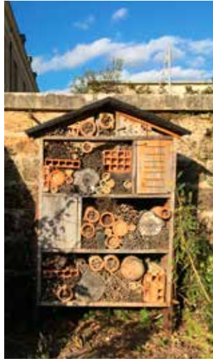
Versailles, Potager du roi, hôtel à insectes.