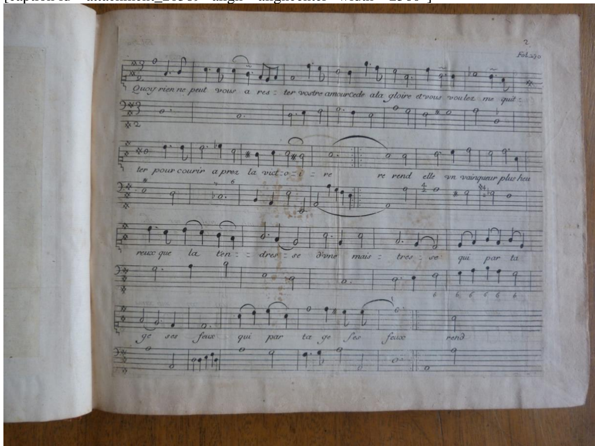
Fig. 1. Air « Quoi, rien ne peut vous arrêter », auteur du texte non identifié, musique de Marc-Antoine Charpentier, Mercure galant , janvier 1678, p. 229-230.[/caption]

[caption id="attachment_20589" align="aligncenter" width="2560"]