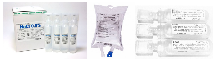
Figure 4. Flacons de diluant

Les diluants utilisés sont le glucosé à 5% (G5%), le chlorure de sodium à 0,9% (NaCl 0,9%) et l'eau pour préparation injectable (EPPJ) (voir figure 4).