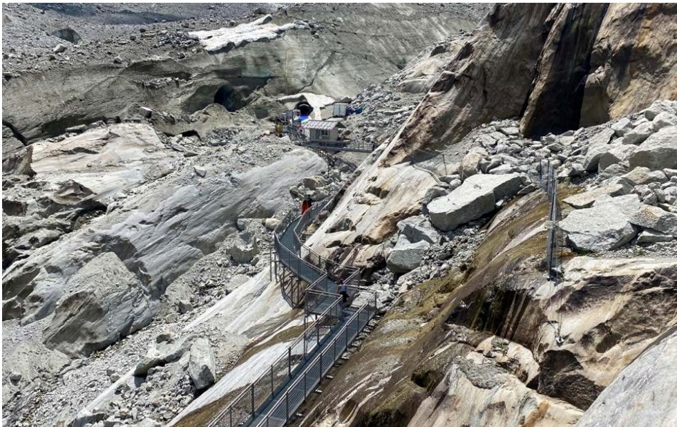
Figure 2. Passerelles d'accès à la grotte de glace