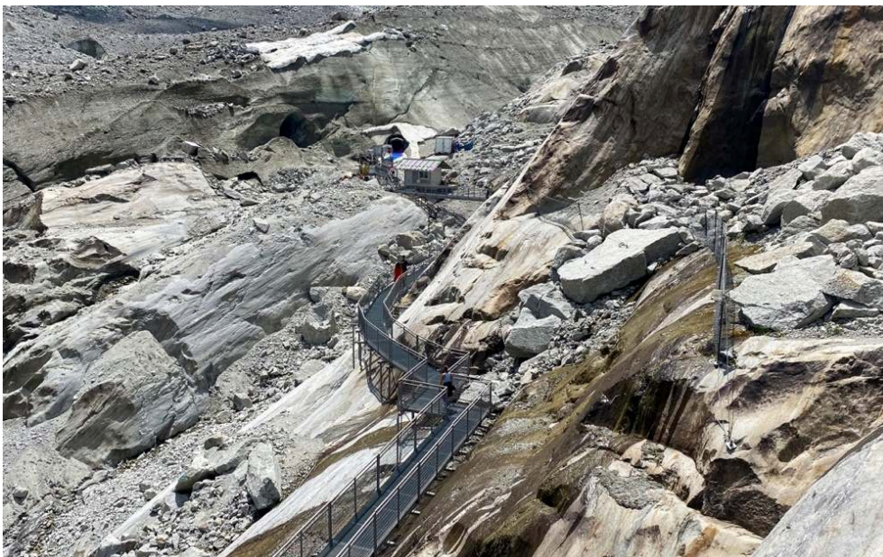
Figure 2. Passerelles d'accès à la grotte de glace