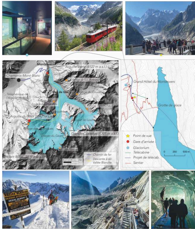
Figure 1. Carte de situation du bassin de la Mer de Glace et du Montenvers

Photos : E. Salim et S. Abrial. L'extension de la Mer de Glace provient de l'inventaire GLIMS ( Global Land Ice Measurements from Space ) de 2013.